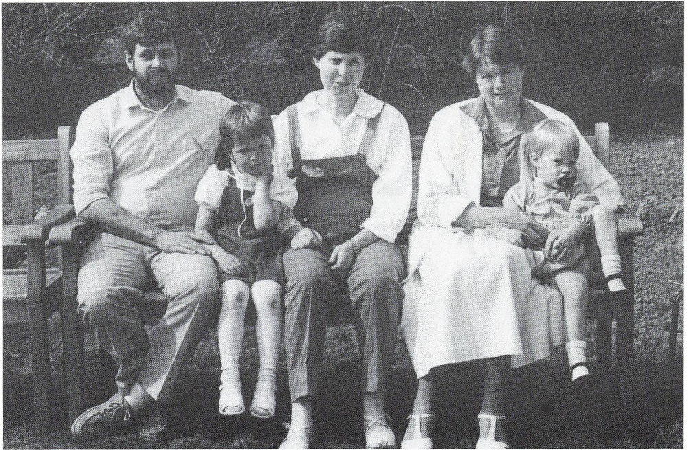
10 års jubilarer