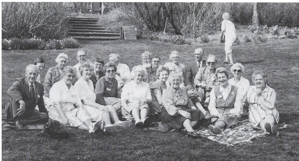
Fra sommerelevstævnet.