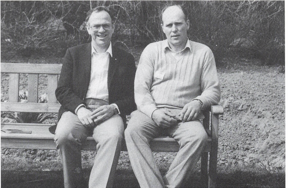
25 års jubilarer