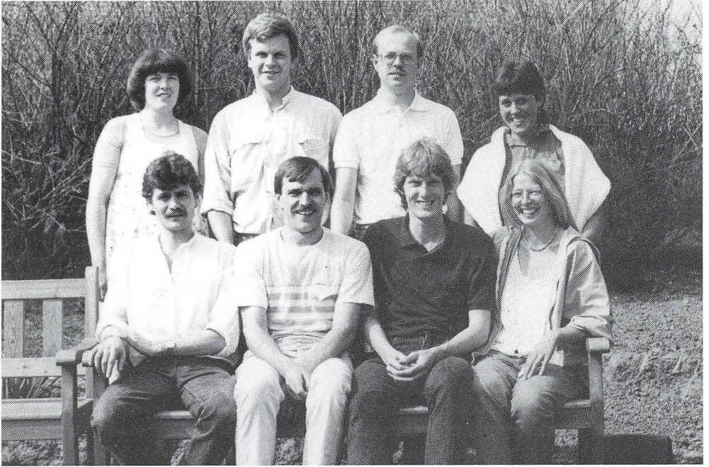
10 års jubilarer