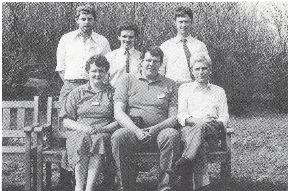
15 års jubilarer