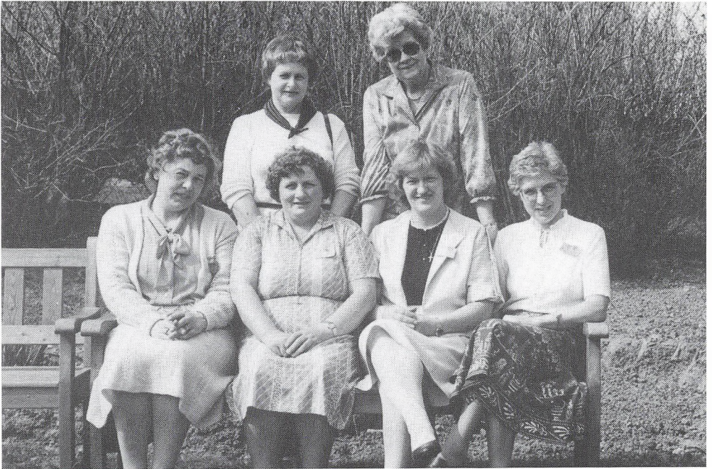
25 års jubilarer