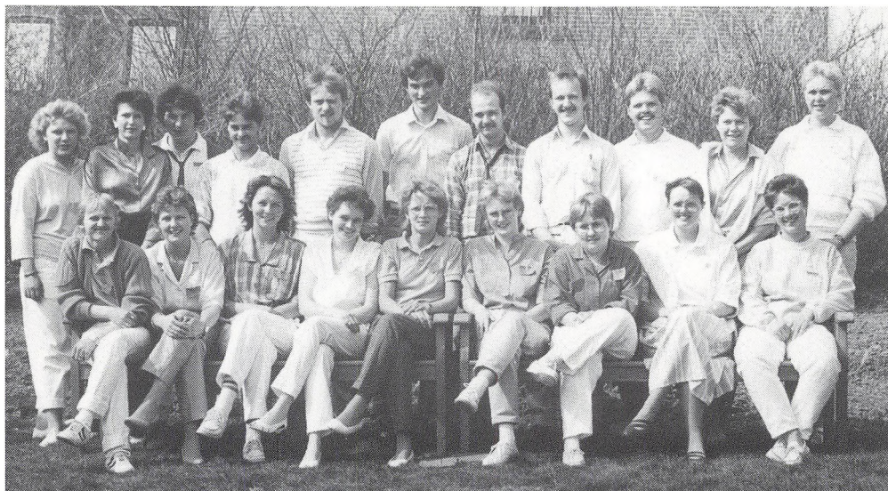
5 års jubilare