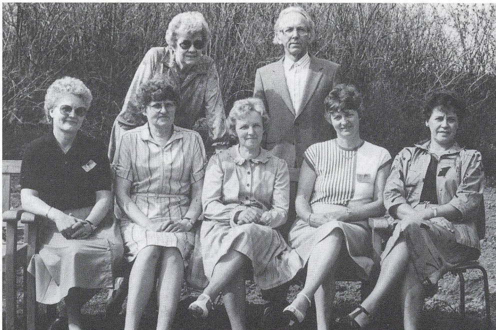
30 års jubilarer