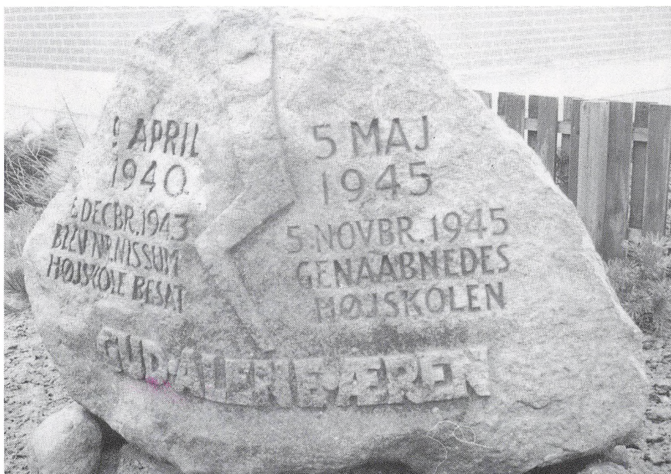
Mindestenen foran skolen.