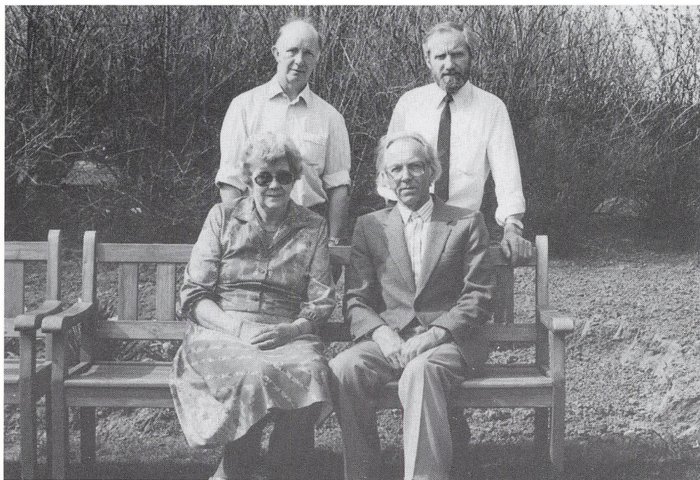
30 års jubialerer