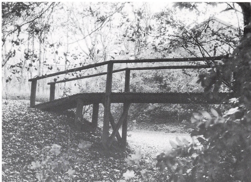
Billede fra haven