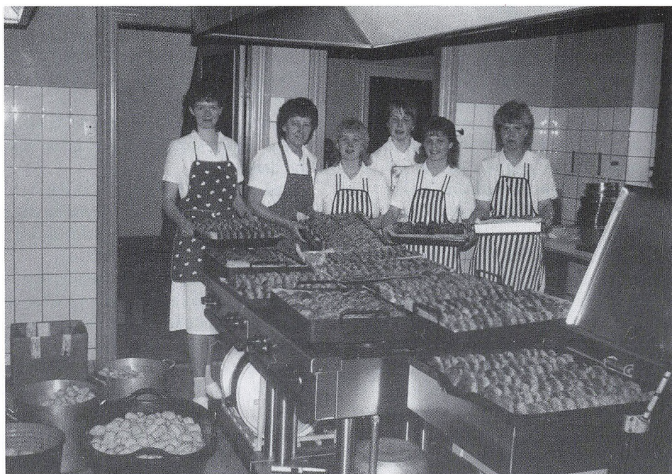
Gunhild og kompagni i aktion.