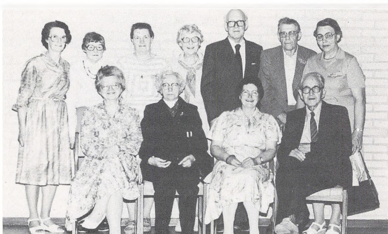
35 års jubilarer. Sommer.