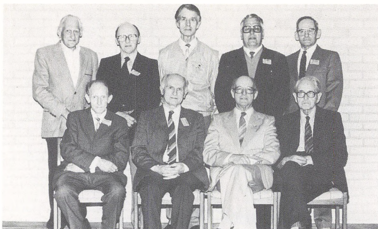
45 års jubilarer. Vinter.