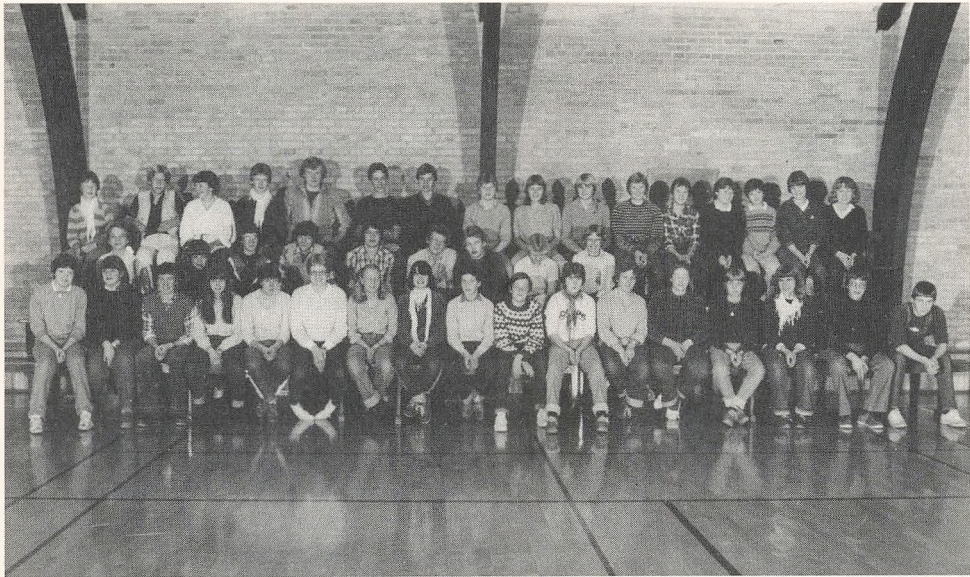
1980/81 elever, hvis forældre eller søskende er tidligere elever.