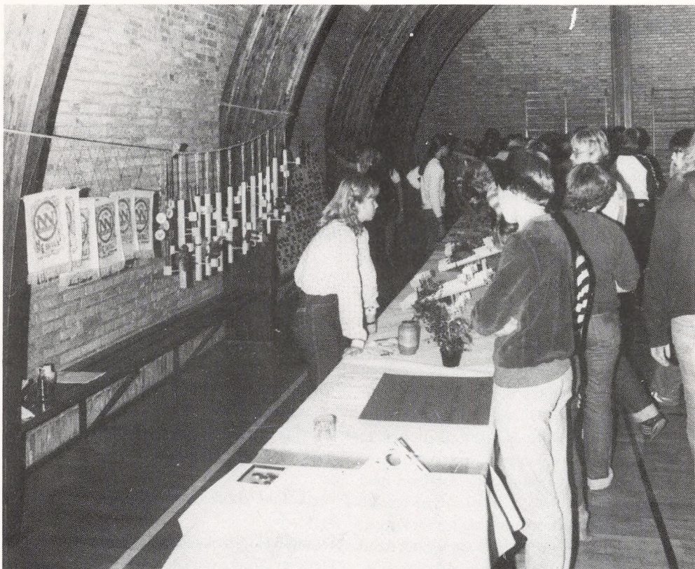
Udsnit af boderne i hallen. Her besigtiges vægophæng, adventsstager og længst tilbage honningkager.

Derefter åbnede basaren i hallen, hvor der kunne købes alt fra brugte fodboldstøvler til honningkager. I samme forbindelse bør også nævnes, at en række originale morskabsboder indbragte et pænt beløb til u-landshjælpen.