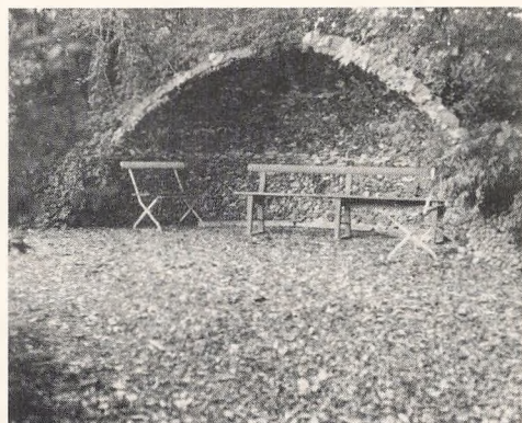
»Grotten« eksisterer stadig