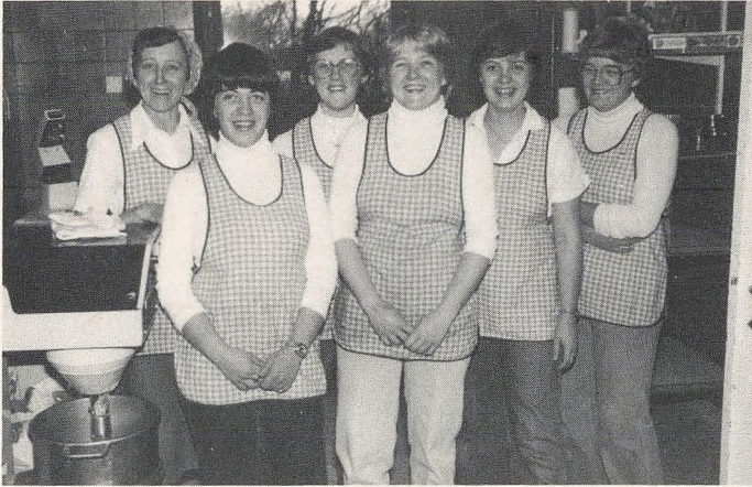
Køkkenpiger i »Galla«.