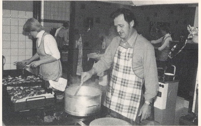
En forstander har mange jobs.