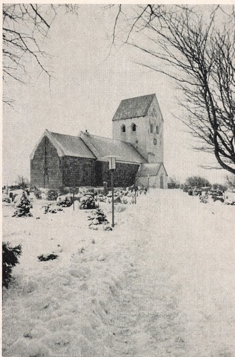
Kirken i vintervej