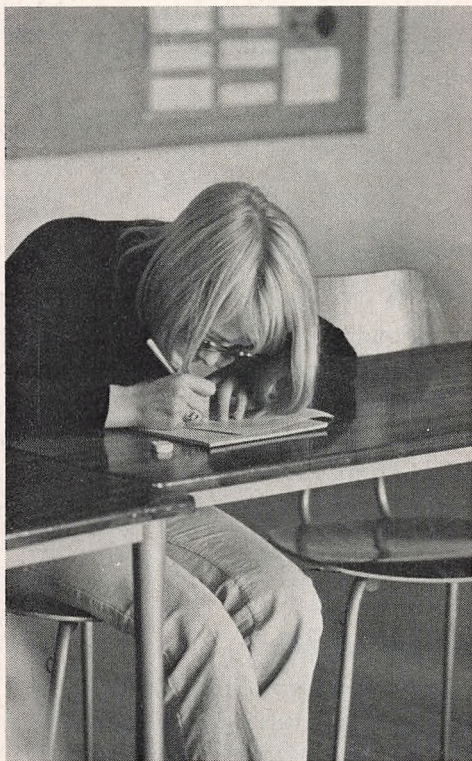
Nr. 3 . Marts 1976 . 68. årgang