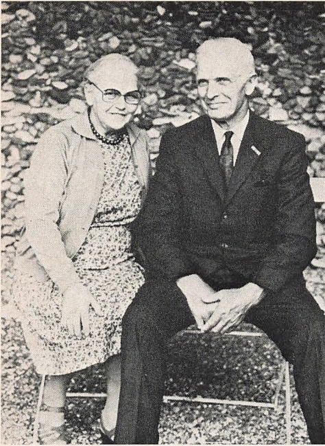
45 års jubilarer