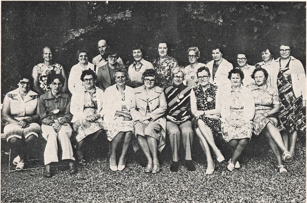
30 års jubilarer