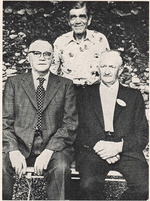
40 års jubilarer