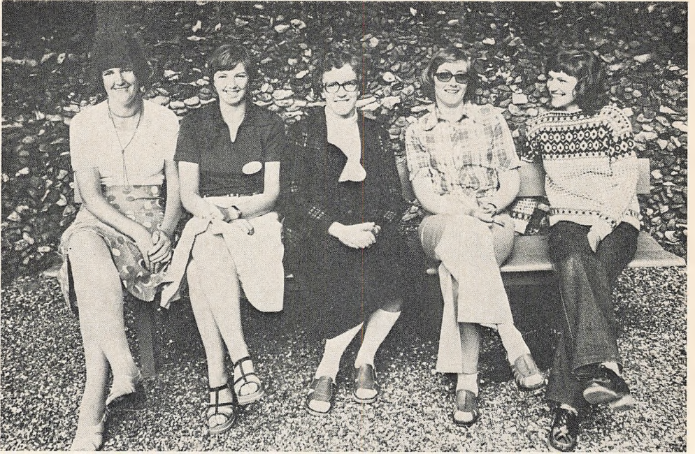
10 års jubilarer