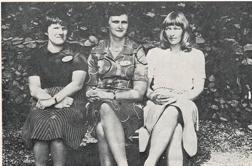
15 års jubilarer