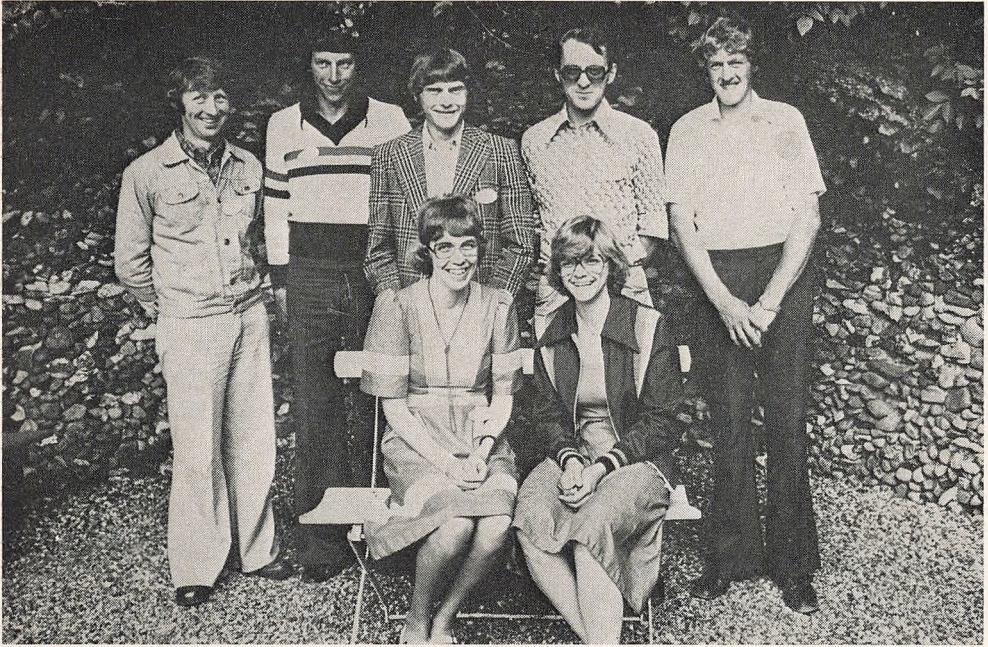
5 års jubilarer