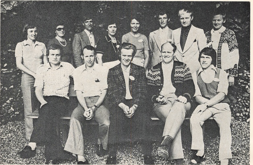
10 års jubilarer