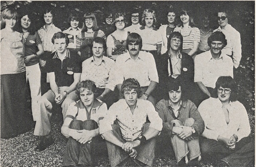
5 års jubilarer