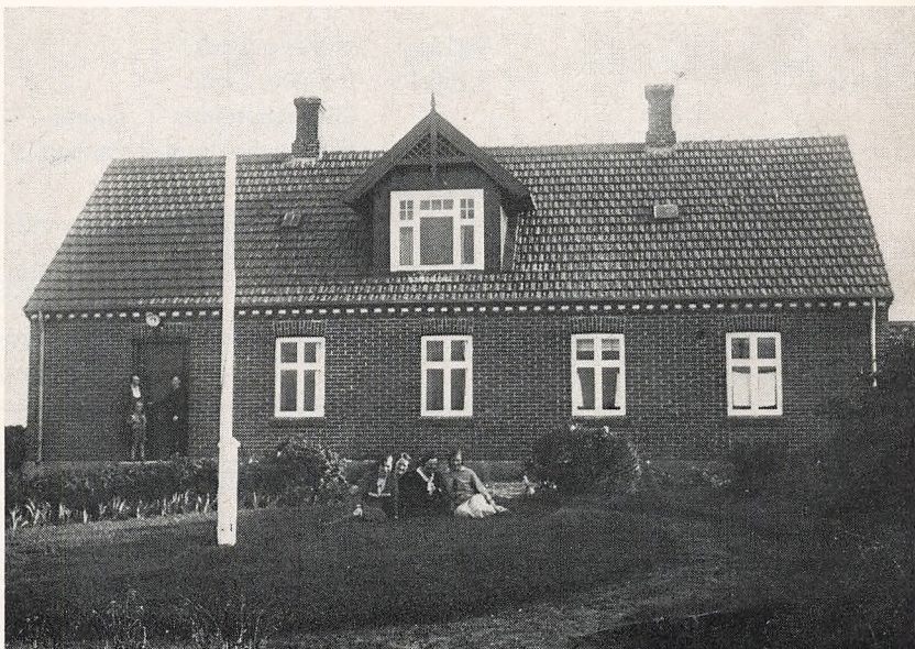
Brejdeblik i gamle dage.