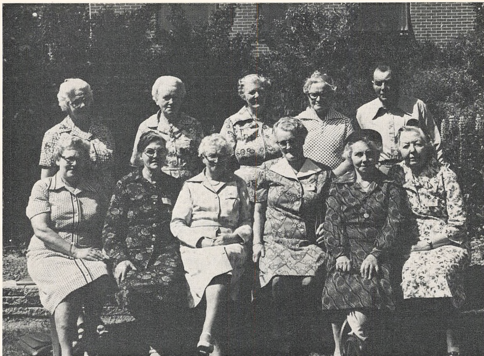
45 års jubilæum