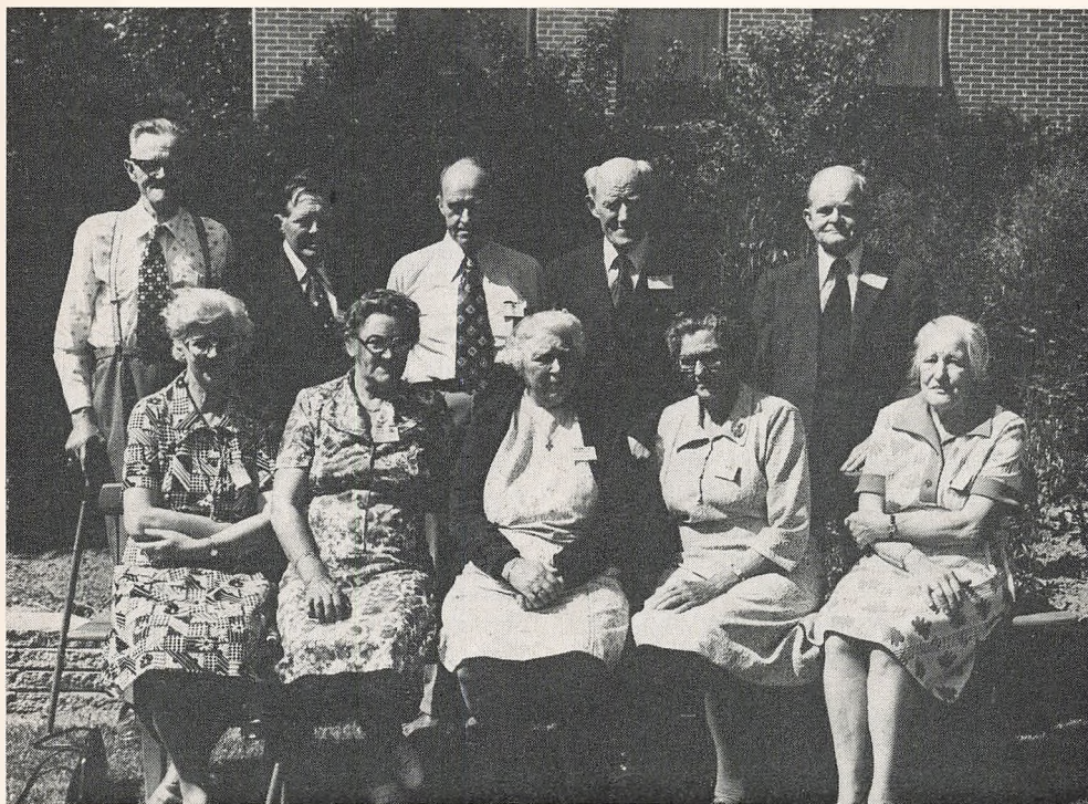
50 års jubilæum

på en meget levende og humoristisk måde om deres virke. Alle var fulde af beundring for deres indsats.