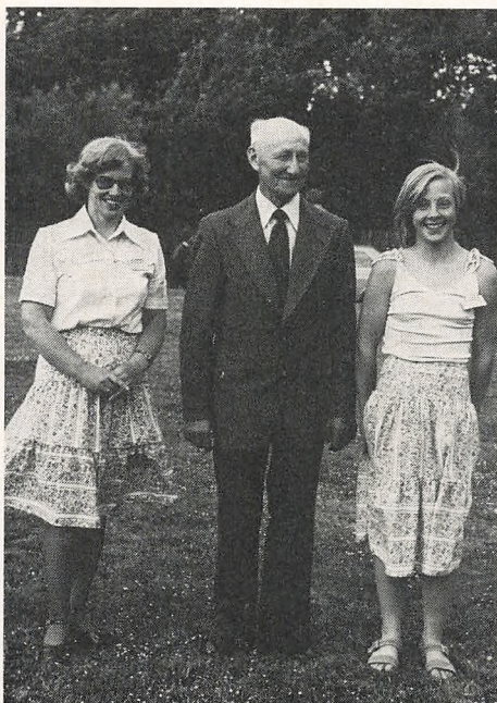
3 generationer ved elevfesten 1978