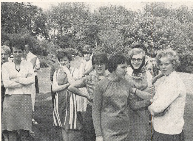
Hvad venter de på