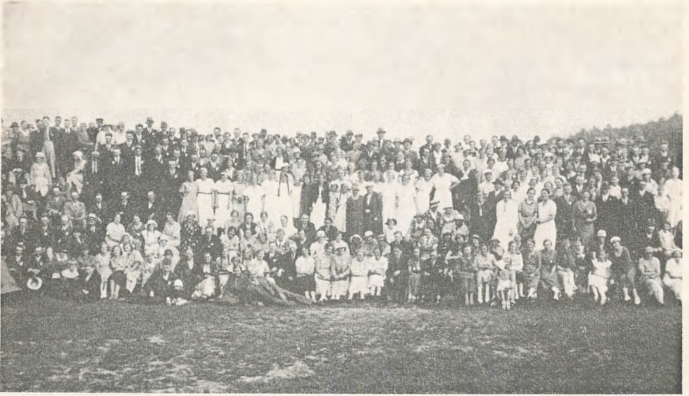
Fra et jubilæums-elevstævne i gamle dage