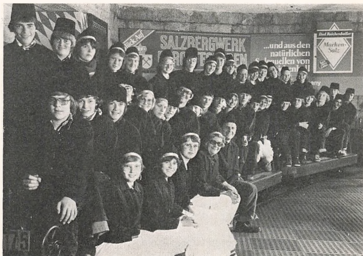
Fra elevernes tur til Østrig

16. november mødes IMs bestyrelse, Fællesbestyrelsen for KFUM og K, og fra alle skoler, der er tilknyttet disse bevægelser, kommer formænd og forstandere. Vi glæder os til en begivenhedsrig dag.