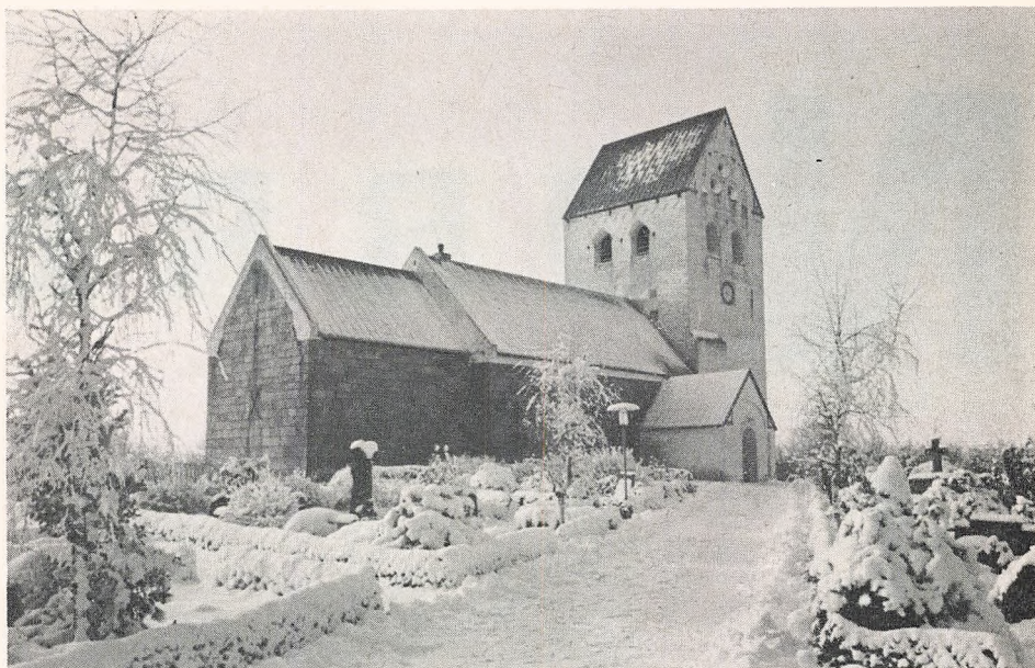
Nr. Nissum kirke i sne.