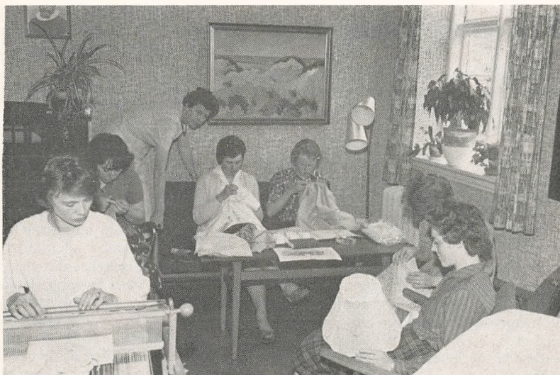
Håndarbejde – dengang elevdagligstuen blev brugt som håndgerningslokale.