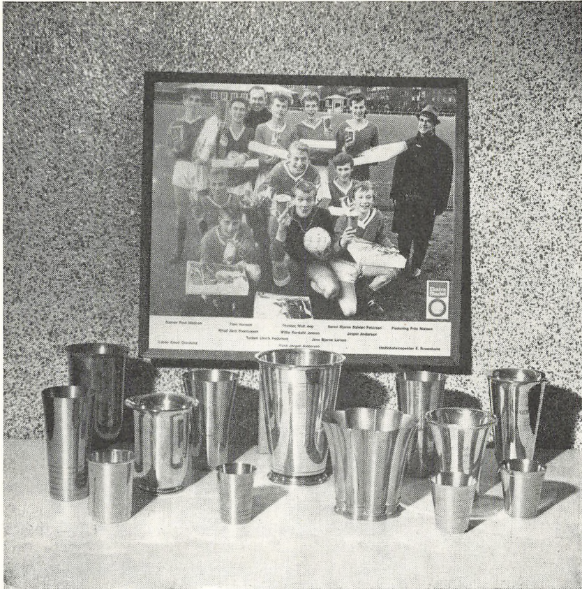
Danmarks mestrene fra Nørre skole, som vandt Ekstrabladets skolefodboldturnering 1965