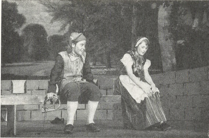
Fra Østre skoles skolekomedie »Molboerne« 19. og 20. november 1965