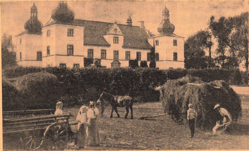
Engelsholm paa Kammerherre Bechs Tid.