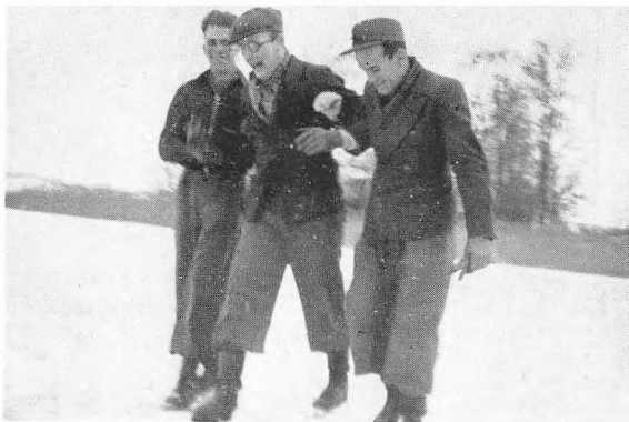
De første trin.