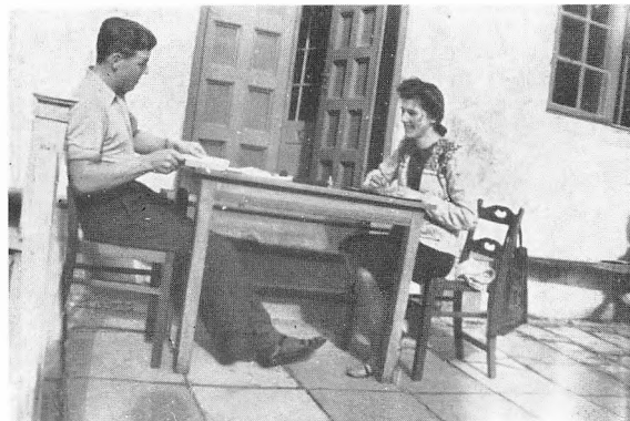
Sommer i marts.