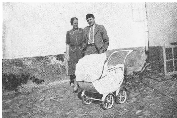
Drengen er indeni.