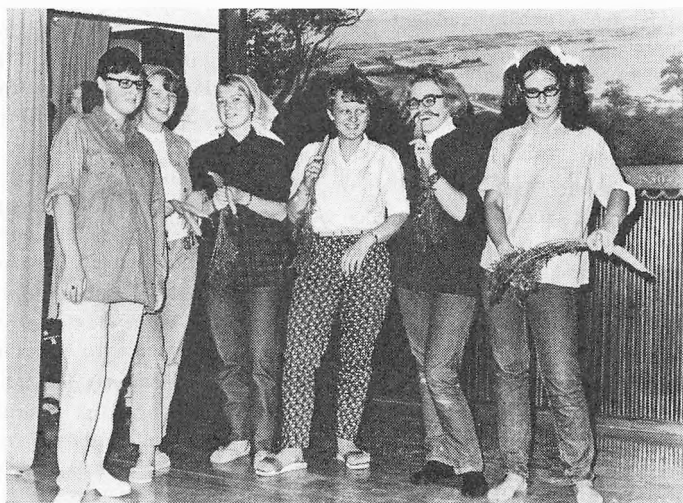
Fra underholdningen ved gensynsfesten