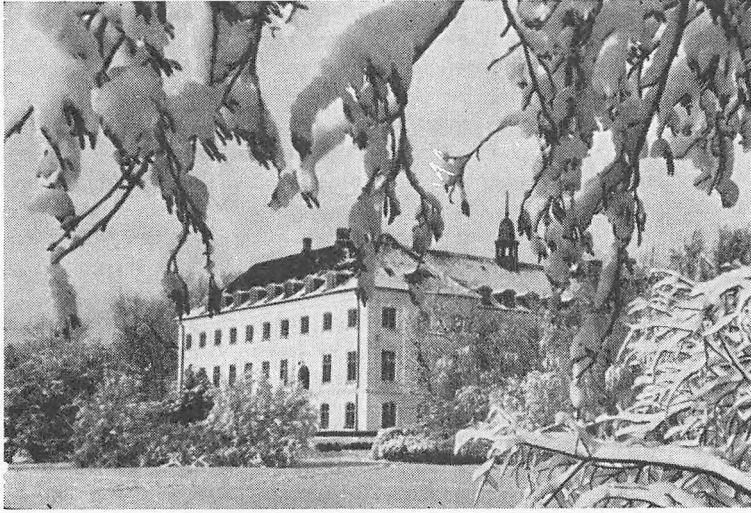
Fårevejle, ind under jul 1968.

I år er der plads til en hilsen i vores julenummer af „Sølvsnoren“ fra enhver af lærerstaben, der føler trang til at skrive en sådan, og jeg har altså grebet chancen.