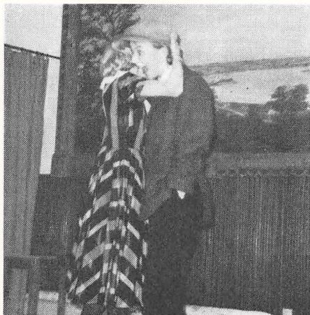
A-holdets opførelse af „Når Kongen kommer“.