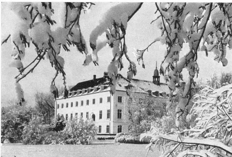
Fårevejle Højskole i vinterdragt.