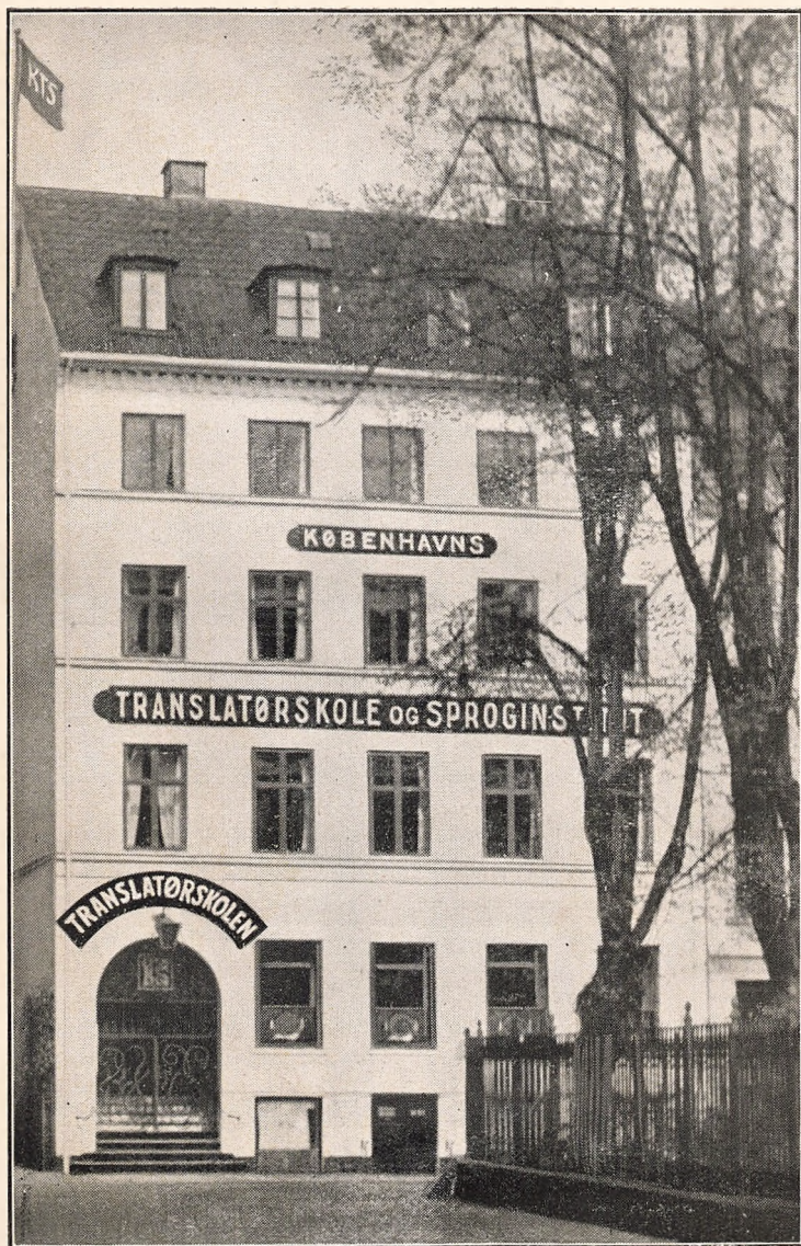
Translatørskolen (set fra Amagertorv)