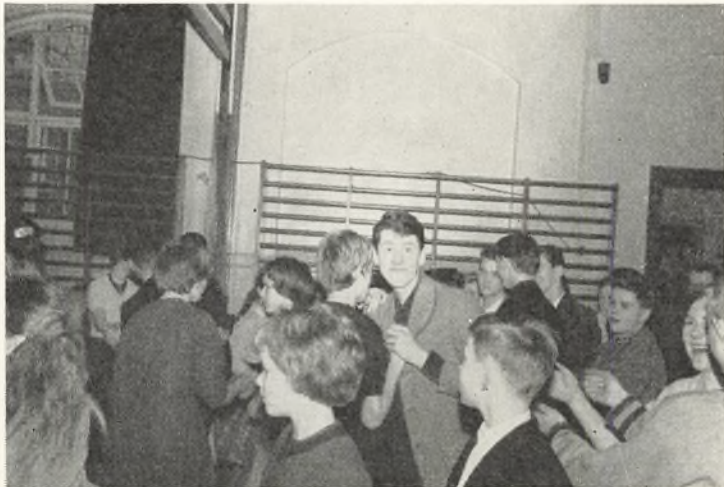
»Formiddagsbal« i gymnastiksalen.

Den første festdag i skoleåret er skolens fødselsdag, 18. august. I år blev fødselsdagsbarnet 68. Al skolegang var suspenderet, festlighederne begyndte fra morgenstunden med flaghejsning og morgensang i gården. Derpå gik det slag i slag med filmsforestillinger, underholdning af forskellig art og traktement.