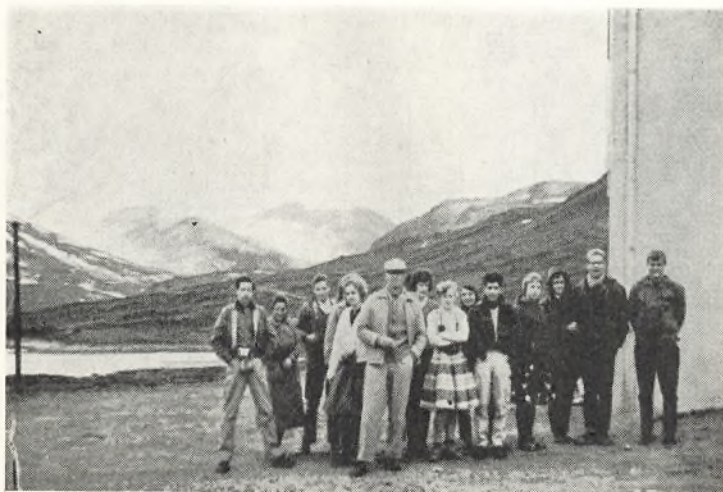
IV v i de norske fjelde.

„Turen gik til Berchtesgaden, hvor vi havde taget ophold i 10 dage på Jugendherberge Strub. Herfra foretog vi dagture, mest til fods. Der var fodtur til Kehlstein, til Königsee med sejltur i 4 timer på søen. En heldagsudflugt med bus gik til Gross-Glockner, hvor vi havde heldet med os, idet solen skinnede i de 4 timer, vi opholdt os på toppen. Det var gribende øjeblikke i den store natur. – – Der