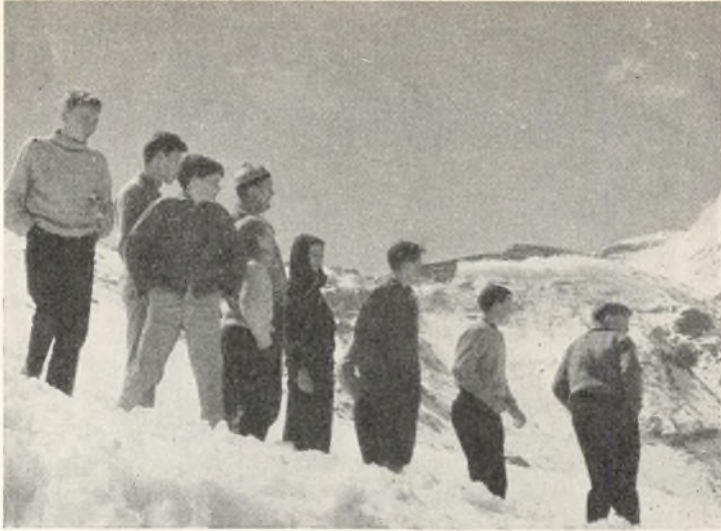
Gross - Glockner.

var liggevogn ned og hjem, så rejsen forløb behageligt. -- Fodturene i bjergene var vel i begyndelsen anstrengende, men mange af drengene blev snart klar over, at sådan oplever man dybest, med varige indtryk."