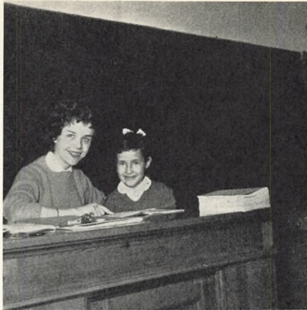
»Det er pænt arbejde«.