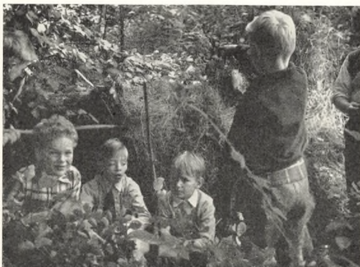
Røvere og soldater.

Det var strålende solskin d. 16. september, vores udflugtsdag. De små tog som sædvanlig i Zoo, de store vovede sig ud på længere ture, mange til Malmø, Lund, Landskrona og Helsingborg, andre foretrak hjemlandets slotte og museer, såsom Kronborg, Frederiksborg, Roskilde domkirke etc. – og nogle tog i skoven.