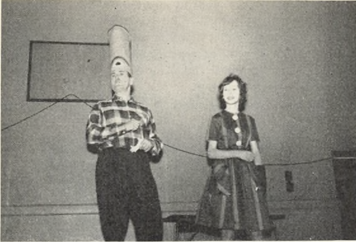
Visen: én er for lille og én er for stor.