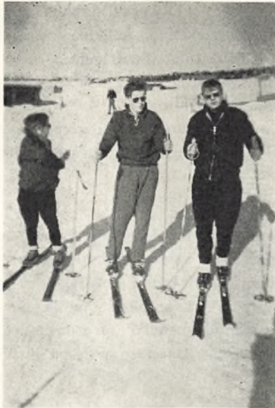
Parat til langrend.

„I dagene 4.–13. marts var III v på lejrskole i Norge. Eleverne havde selv sparet sammen hertil i et par år. – Der blev foretaget udflugter fra Hunder vandrerhjem (nær ved Lillehammer), og om aftenen blev der så skrevet rapport. – Der var også god tid til at dyrke vintersport, og under en dygtig skiinstruktørs