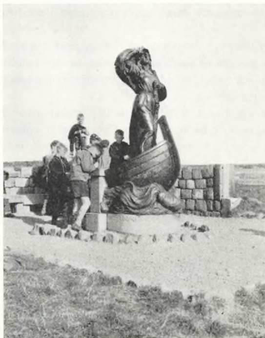
Dronning Dagmar, Riberhus, III A 1959.