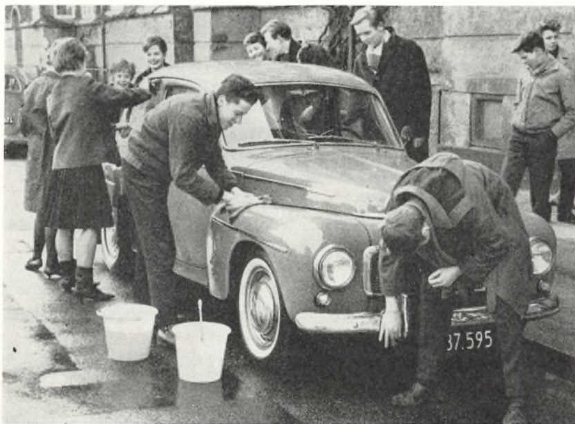
Det koster 10 kr., hr. lærer — til U-landshjælp.

En række nye fag og faggrupper er kommet ind i undervisningen fra og med dette klassetrin. Før var alle fag fællesfag. Nu er der kommet nye til, de såkaldte specialfag og supplerende fag, som børnene har kunnet vælge imellem, før de begyndte i 8. klasse. Under fællesfagene hører dansk, regning, religion, orientering (nyt fag) og legemsøvelser. Specialfagene er inddelt i tre faggrupper: 1. engelsk, regning og maskinskrivning (handelsfag), 2. fysik og kemi, geometrisk tegning og produktionslære (tekniske fag), 3. sløjd og faglig tegning (industri og håndværksfag). Af klassens 24 elever valgte 6 første faggruppe, 17 anden og 1 sidste faggruppe; men da der normalt kræves mindst 7 for at gennemføre en faggruppe, måtte sidste elev vælge om. Hver faggruppe dækker 8 timer på ugeskemaet, og fællesfagene ialt 20. Det pligtige timetal er 28. Hvad eleverne valgte af timer udover disse 28 er valgt af egen fri vilje og i et ønske om at få så meget ud af skolegangen som vel muligt. Der var ialt 6 supplerende fag at vælge imellem, og flere valgte mere end et. 8 elever valgte engelsk (alle fra specialgruppe 2, som ikke havde engelsk med her), 7 valgte tysk, 7 maskinskrivning (elever fra specialgruppe 2), 14 matematik og 6 sløjd.