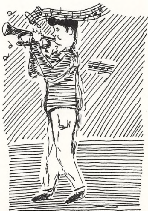
Musik skal der til. Tegnet af Ole Tang, 6 av.