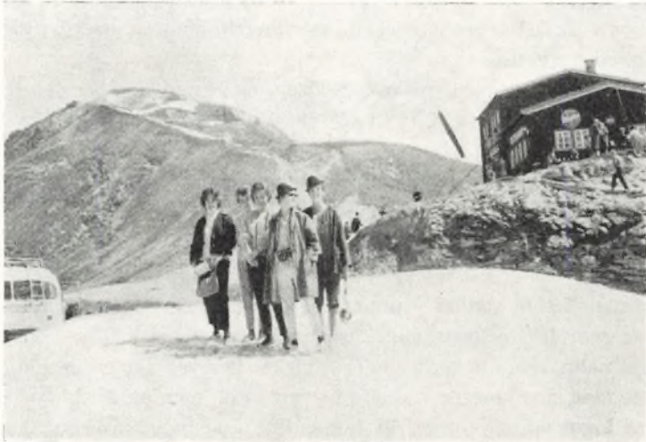
Trætte vandrere på vej til tops.

Her oplevede vi det for Østrig helt usædvanlige, at solen bagte fra morgen til aften og at der ikke kom så meget som en dråbe regn. Vi besøgte byens seværdigheder og havde udflugter til saltminerne i Hallein og til vandslottet i Hellbrunn. Det blev endnu varmere, da vi efter tre dages ophold rejste til Venedig.