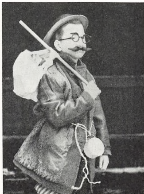
Fastelavn er mit navn . . .

begyndte med skolebal fredag aften 2. marts. Salen var pragtfuldt pyntet med masker, ris, køller og hvad nu fantasien kan knytte til fastelavn. Danselysten var stor, og kokke-viceinspektør Hemmingsens pølser gjorde lykke. Dagen efter fortsattes festen i skoletiden. De små elever mødte i dejlige forklædninger, og de fik morsom underholdning: marionetspil, skolerevy. Ja, til sidst blev der endog tid til lidt dans i den fine sal.