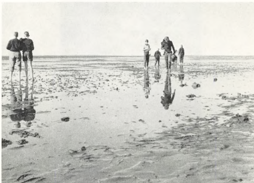
Ebbetid i Vadehavet. III A 1959.

Spørgsmålet, om hvorfor vi da tager på lejrskole, kan naturligvis besvares på samme måde, som man kort for hovedet kunne besvare spørgsmål om undervisning i det hele taget: Vi skal lære noget og bestille noget!