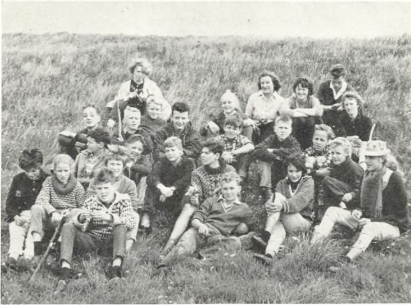
Hvil på havdiget med 7 au, 1961.

Men et sådant svar vil være højst ufyldstgørende, for vi kan dog lære – og lærer da også stadig vore elever en hel del herhjemme om de emner, der tages op på en lejrskole – og lærer dem forhåbentlig også i det hele taget at bestille noget.