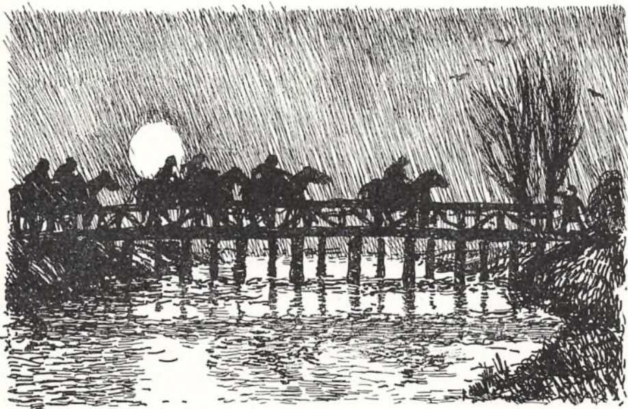
Niels Ebbesen og hans mænd rider over Randers bro. Illustration fra en af de ny historiebøger.

En kæmpemæssig omgruppering af det historiske stof har fundet sted, og selv om der er skønhedsfejl, må man erkende, at der har været en mærkbar bedring. Lærebøgerne er mere fyldige, sproget bedre egnet for børn og illustrationerne flere og bedre end før, og desuden giver vi jævnligt eleverne andre, som regel mindre bøger, med hjem til supplerende læsning. Disse kan danne grundlag for elevforedrag og diskussioner. Bøgernes og lærernes (elevernes) fortælling bør fremdeles være det centrale, men der udover står der flere hjælpemidler til rådighed i dag. Vi er begyndt at abonnere på skoletidsskriftet „Columbus“, der behandler aktuelle emner og er beregnet for de større elever.