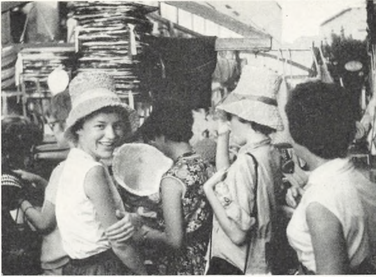
Pigerne prøver hatte i Venedig.

Romantikken og det sydlandske præg betog alle, selv om vore fem kavallerer havde deres mas med at holde alle de temperamentsfulde, sorte italienere paa afstand fra de lyse Vibepiger. Også disse skønne dage fik alt for hurtigt ende, og turen gik videre til Lugano.