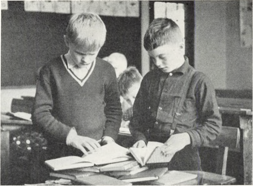
Der arbejdes med klassebiblioteket.