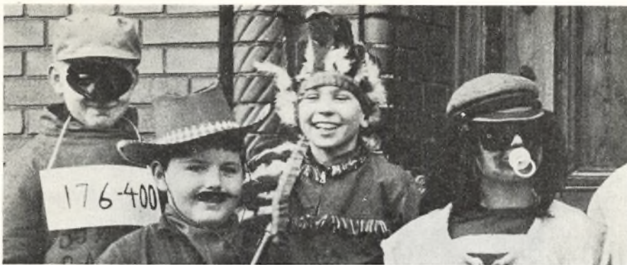
»Fastelavn er mit navn . . .«.

Klasselærerne kunne fra skolefonden disponere over 50 øre pr. elev til en lille forfriskning.