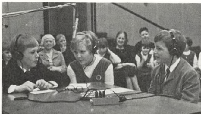
»Tre mand frem« i radiostudiet.