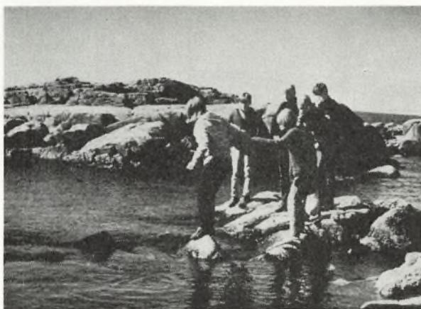
Kysten ved Svaneke.

I Svaneke var vi flere gange inde for at løse opgaver. Hvert hold havde sin specielle opgave. Nogle skulle tale med fiskerne, andre med røgeriarbejderne og nogle skulle både tegne og skrive om stubmøllen og vand- og udsigtstårnet.