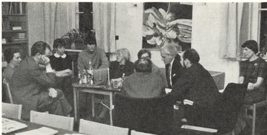
For første gang i skolens historie overværer elevrådsrepræsentanter et skolenævnsmøde.

Af arrangementer har vi foruden de sædvanlige skoleballer, som har været ganske pænt besøgt, afholdt en filmaften, hvor vi viste en række kortfilm for et ret stort publikum, bestående af elever fra 7.-10. klassetrin.