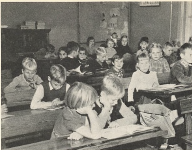
Fri læsning i 2 y.