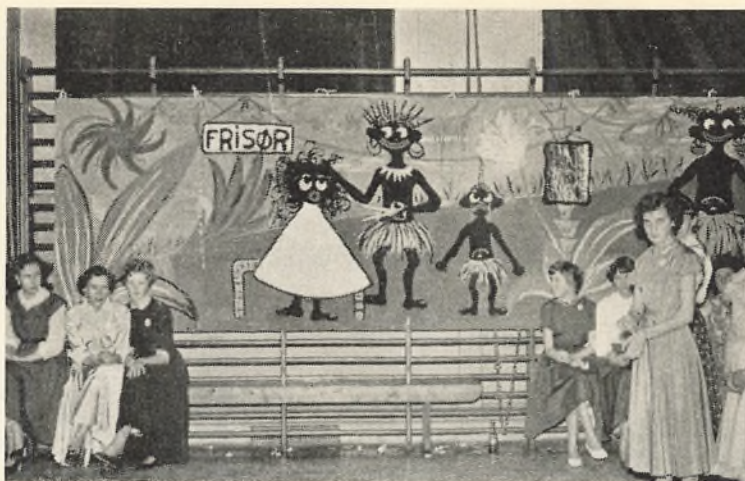
Vægmaleri til skoleballet.