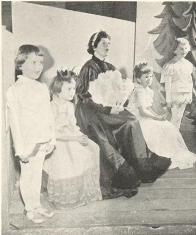
Scenebillede fra „Guldskoene“. Kejserindens hof.