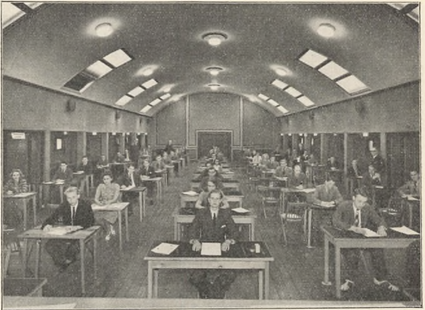
Festsalen som Eksamenslokale.