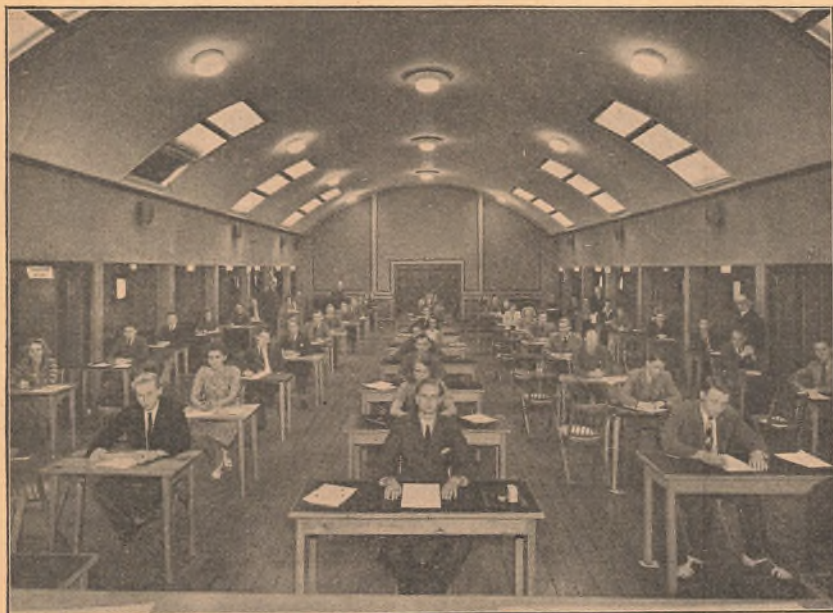
Festsalen som Eksamenslokale.