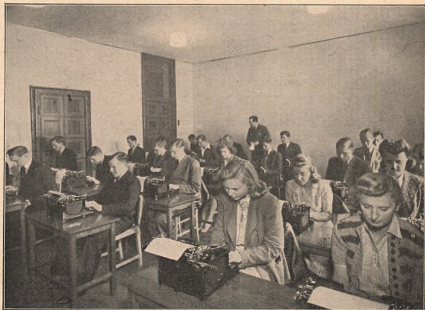
Et af Maskinskrivningslokalerne.