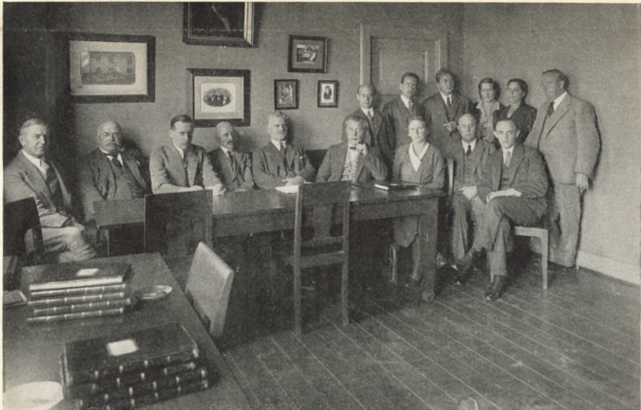
Slagelse højere Almenskoles lærerkollegium 1933.