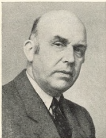
Sv. Bruun 1936—1940