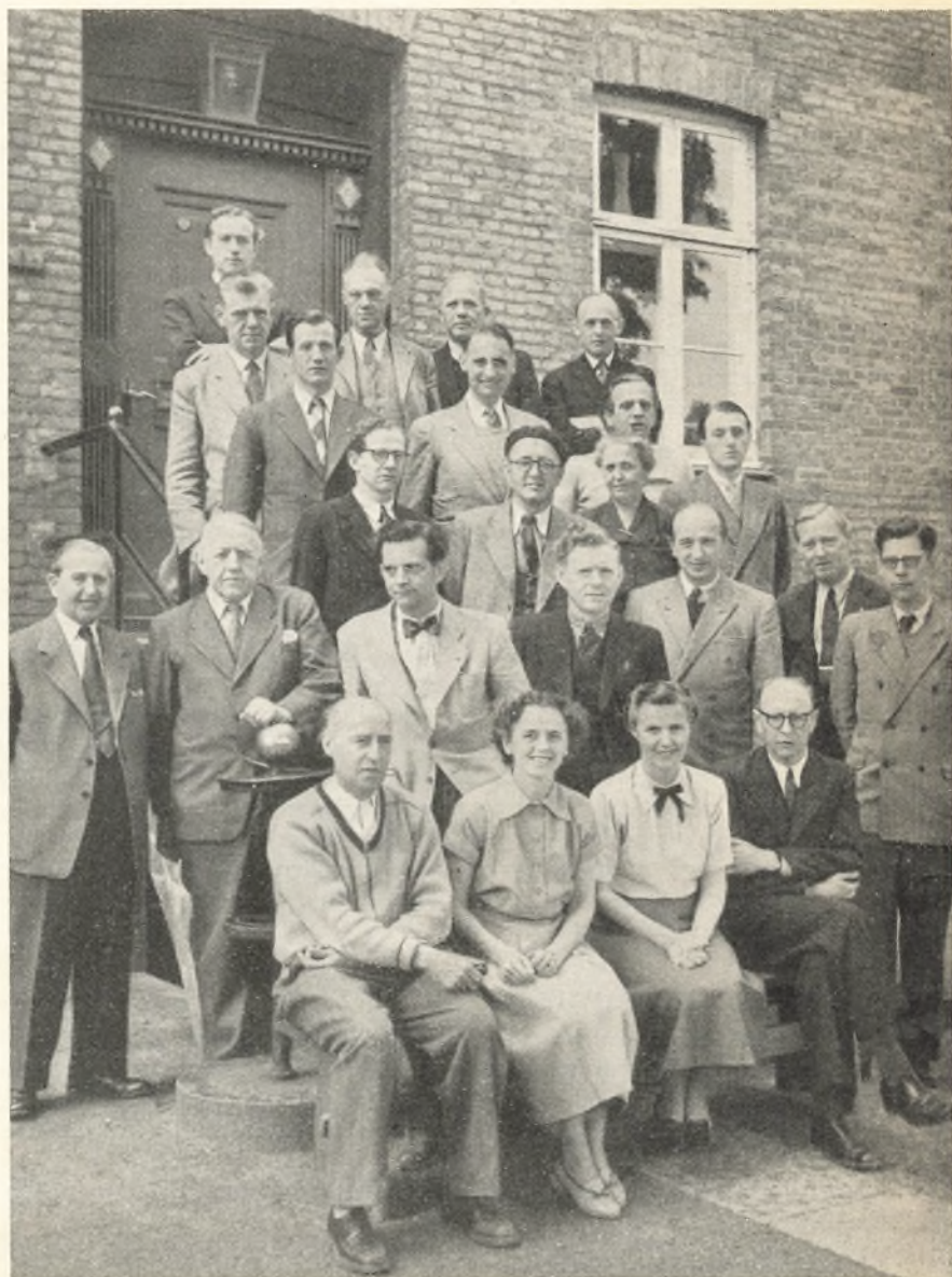
Slagelse kommunale Gymnasiums lærerkollegium 1952.