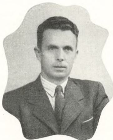
Elev på Esbjerg Arbejderhøjskole 1928—29. Medlem af DSU's hovedbestyrelse fra 1931—37. Formand for Arbejdernes Fællesorganisation i Nyborg 1935—39. Indvalgt i folketinget 3. april 1939. Sekretær i rigsdagsgruppen maj 1950.

Efterhånden som man vinder ind på de 15—20 km passeres et par af vore gamle landsbykirker. Tankerne glider ind på den efter sin tid kolosale investering, datidens kirkebyggere her har bragt for at skaffe en ramme om tidens folkerørelse, hvor slægt efter slægt har hentet livsmod til at overvinde hverdagens hårdhed og vinde troen på, at efter denne må der være anden og blidere verden.