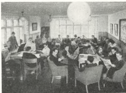
Eleverne hygger sig i dagligstuen.