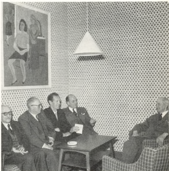
Forhallen er ikke til at kende igen.