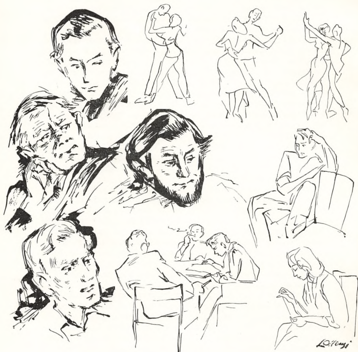
Små Løllesgaard-skitser af liv og elever på Roskilde højskole.