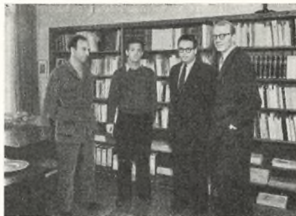
Skolens faste stab.