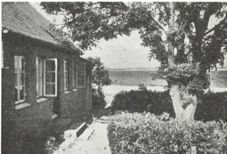
Week-endhytten ved Helnæsstrand