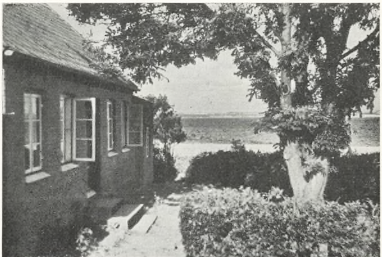
Weekend-hytten ved Helnæsstrand.