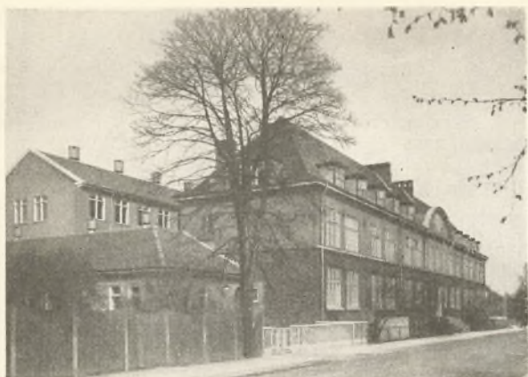
Skolen set fra Skolevej