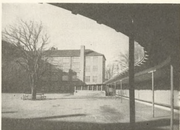
Skolen set fra et Hjørne af Legepladsen,