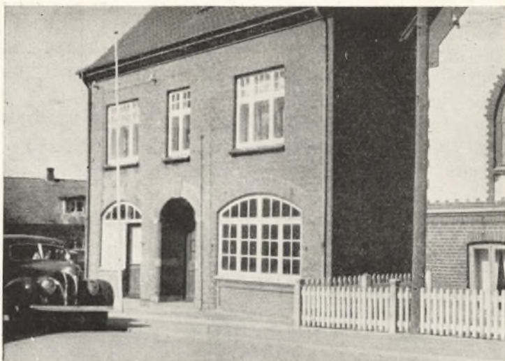
Kirkevej Nr. 1. Gymnastik- og Forsamlingshuset Bakkely

„Gymnastik- og Forsamlingshuset Bakkely“, nu Kirkevej 1.