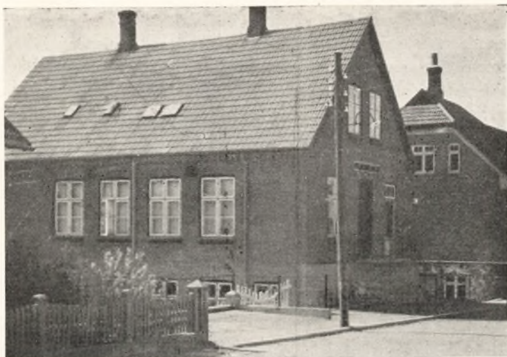
Kirkevej Nr. 6, Nr. Aaby Realskole 1897-1910

Eleverne var til at begynde med i Alderen 9—14 Aar; Skolepengene var 4—6 Kr. maanedlig.