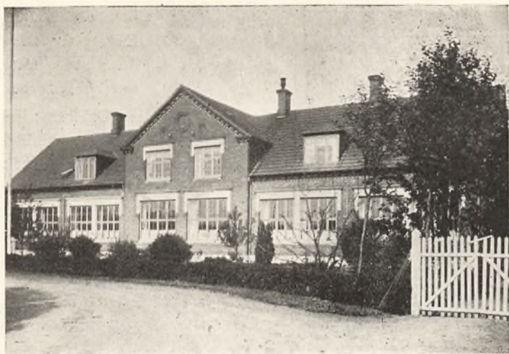
Norre Aaby Realskole, opført 1910