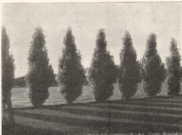
Aftenfred paa Skolens Læseplads