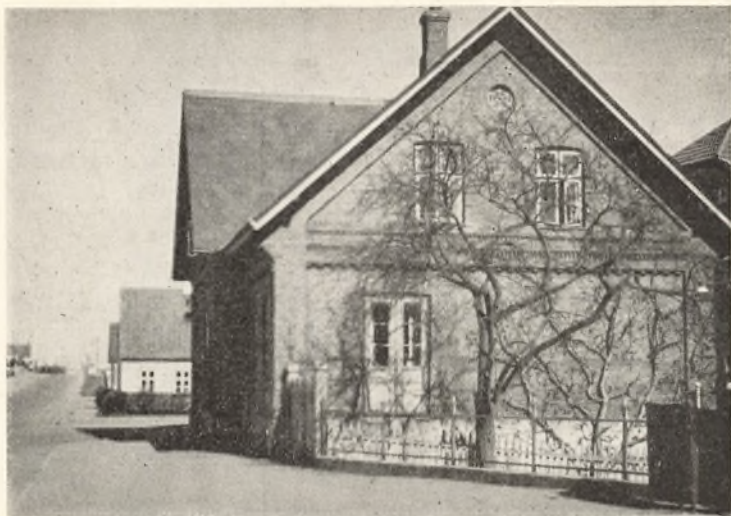
Kirkevej Nr. 2

antal erhvervedes en Naboejendom til Beboelse, nu Kirkevej 2.