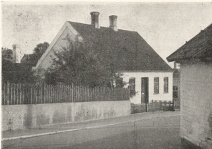
Svinget Nr. 7, Norre Aaby Realskoles første lokaler