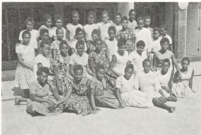
Skolens første elevhold.

På en eller anden måde har I sikkert hørt om Karen College, der er beliggende på Karen Blixens tidligere kaffefarm i Kenya. Vi, min mand og jeg, er udsendt for en 2-årig periode som lærer i henholdsvis havebrug og ernæring. – Jeg véd, der har været en del presse fra den officielle åbning i september 1966, hvor udenrigsministeren og finansudvalget repræsenterede Danmark. Derfor kun ganske kort om Karen College i forbindelse med Karen Blixens farm.