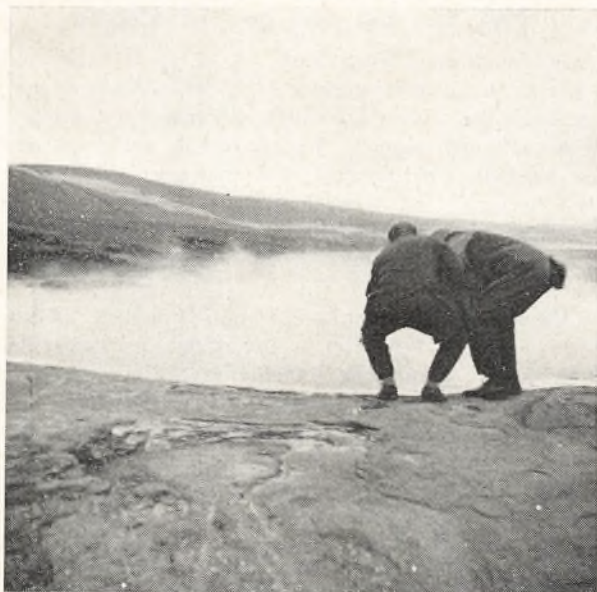
De danske styremedlemmer undersøger, om vandet i de varme kilder er varmt.

Vi besøgte bl. a. hendes sommerskole ved Laugavatn, hvor vi så de varme kilder, herunder også den nu så rolige, gamle Geysir.