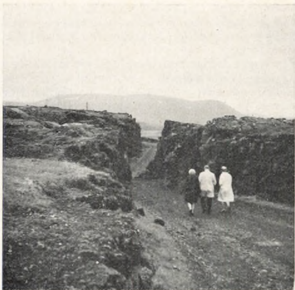
En del af selskabet på vej gennem Almannagjá ned til Tingvellir.

standard, skønt de er færre end 200.000 mennesker, og skønt der ingen mineraler findes i det store, barske og øde land.