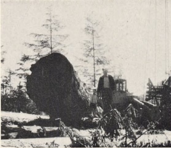
Fældning af Cedertræ

Min familie bor i en lille by Tolino, som ligger på vestsiden lige ud mod Stillehavet. På turen dertil passerede vi et skovområde, som er fredet; der er blandt andet en del Douglasfyr, og på et skilt kan man læse: »Disse træer var unge, da Columbus var ung«. Der er i øvrigt mange store cedertræer på øen.