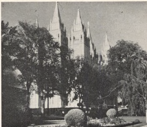
Tempel og Tabernakel Salt Lake City

pyntede bilerne til optoget med farvestrålende papir; amerikanerne bruger ofte hele farveskalaen. Om formiddagen kl. 9 begyndte optoget gennem byen, i alt 132 numre: biler, musikkorps, klovne og rideoptog.