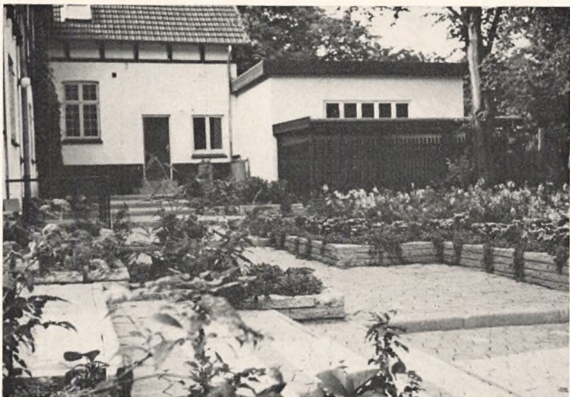
Gårdhaven Gl. Ankerhus

Med den udvikling, der gennem årene har været i børneinstitutionerne, er det svært for disse samtidig at tilpasse børnenes daglige rytme og modtage ret store elevhold i kort periode. Den velvilje og interesse, lederne i de nye institutioner viste for skolens ønske om fortsat at give eleverne indblik i børns pasning og beskæftigelse, gjorde det muligt at fordele eleverne i 2 perioder af en uge, enten i vuggestuen, børnehaven eller legestuen.