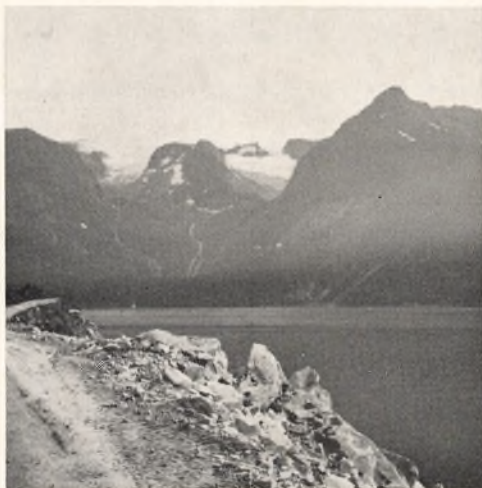
Glimt fra Nordnorge med indlandsisen i baggrunden