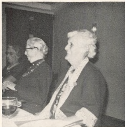
En festglad frk. Buckhøj

I august inviterede 3. klasse lærerne med ægtefæller til det årlige fætterbal — i år på Hotel Postgaarden, hvor vi blev højtideligt introduceret af »Kong Poul« i fuldt ornat.