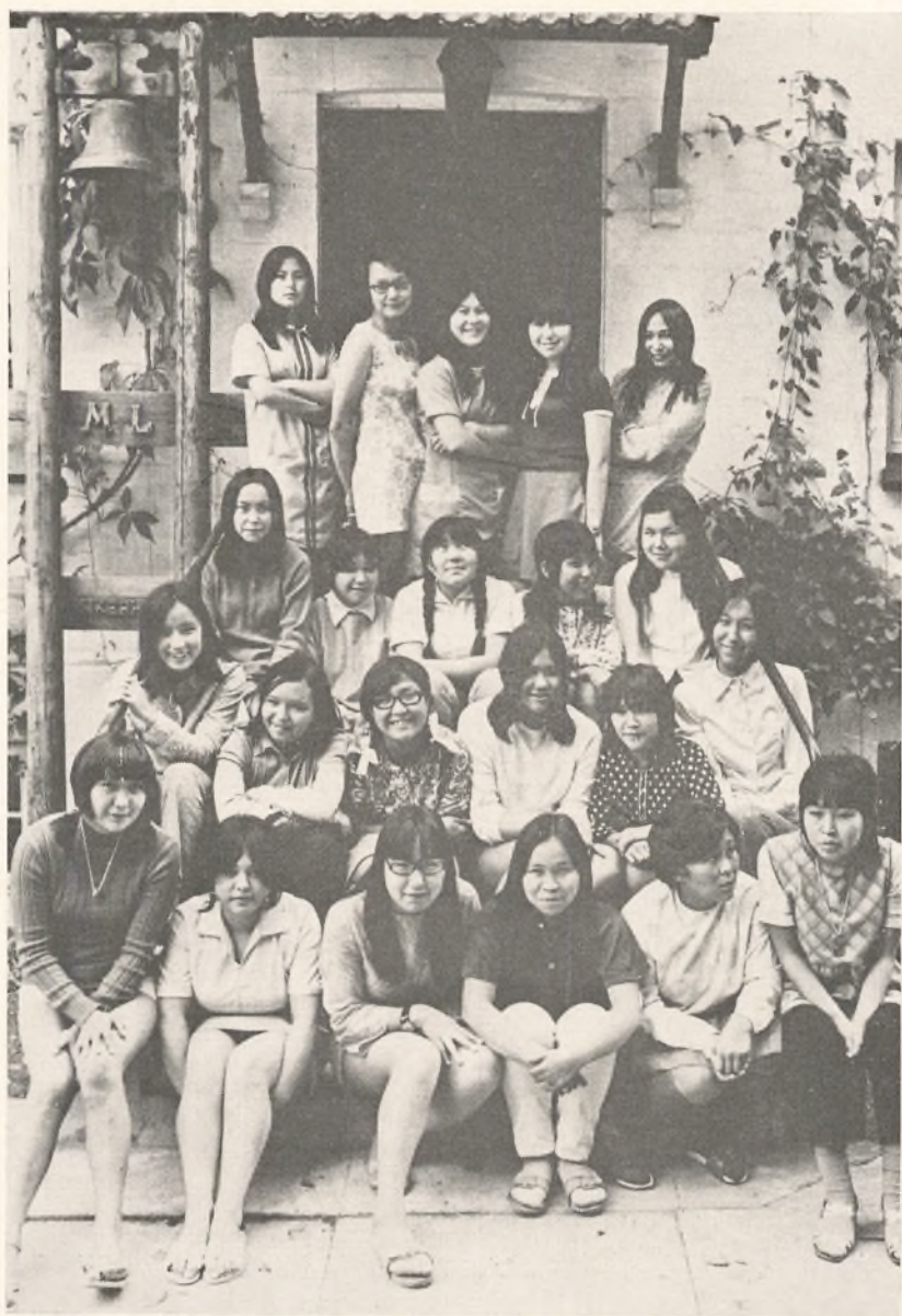
Gronlænderkurset juli 1971