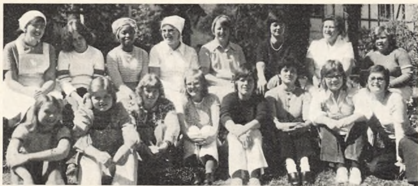
Øvelsesskolen februar 1973

25 elever påbegyndte skolens andet 5 mdr.s kursus. Det var en glæde for lærerne at kunne undervise på et kursus, der ikke var den første af sin art på Gl. Ankerhus.