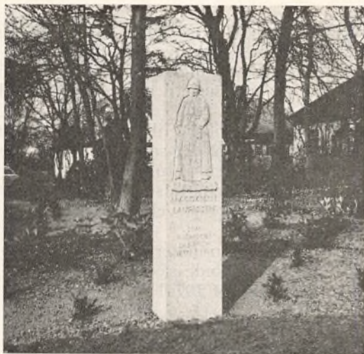
Elevforeningens gave til institutionen