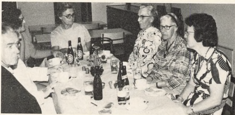
Indvielse af pavillonen

Det var med glæde, vi i august tog pavillonen i brug; desværre var institutionskøkkenet ikke helt færdigt, bl. a. på grund af leveringsvanskeligheder m. h. t. institutionskøkkenudstyr. Maskinerne er nu ankommet og indsat i køkkenet.