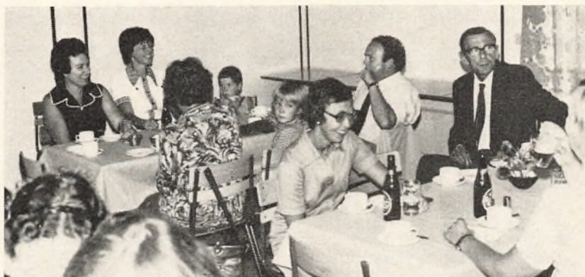
Indvielse af pavillon

Forstanderboligen på skolen er sat i bero, bl.a. fordi frednings-sagen med hensyn til »trekanten« ikke er afklaret.