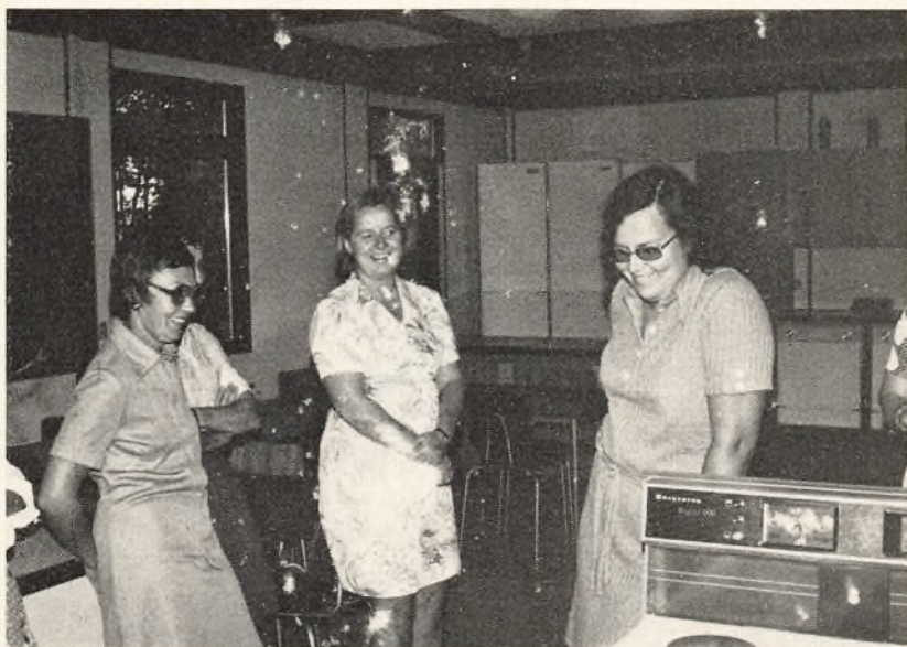
4 lærere ved indvielsen af pavillon

Vi har derfor selv pr. 15. august købt hus, Peter Damsvej 27, til overtagelse 1. november.