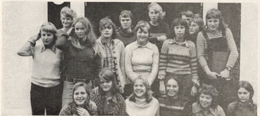
Øvelsesskole august 1973

De erhvervsfaglige grunduddannelser er en forsøgsundervisning. Formålet er at tilrettelægge et 12-årigt uddannelsesforløb som alternativ til bl. a. »mesterlæren«. Uddannelsen bygger på 9 års skolegang. Et af de 6 hovedområder inden for disse uddannelser er levnedsmiddelområdet.