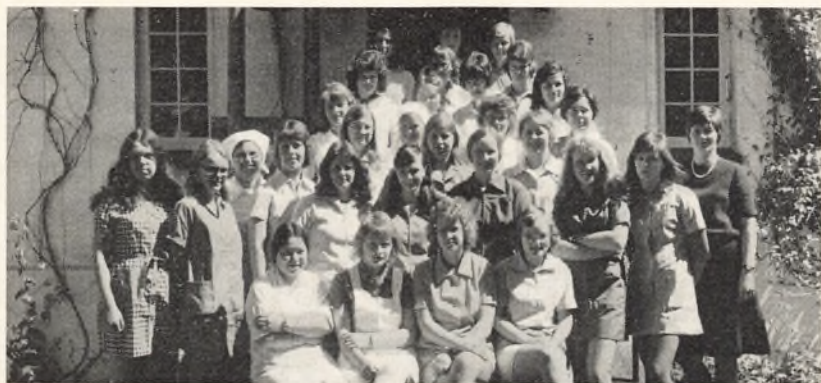
Forkursus maj 1972