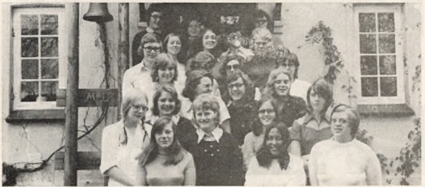
5 mdr.s køkkenlederkursus august

forestås af 3. seminarieklasser, praktiklærerne er som sidste år, husholdningsskolens lærere og seminariets lærere.