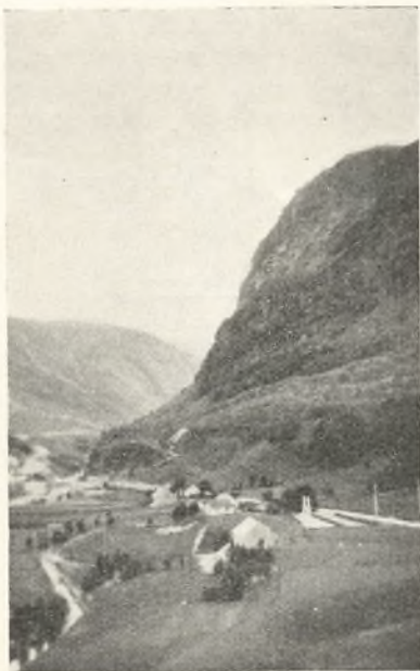
Byrkjeda 1 .