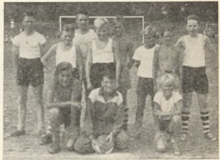
Det sejrende hold

26. okt.: Besøg af erhvervsvejlederen, hr. Brøndum Jacobsen, som talte med 7. klasse og om eftermiddagen med forældre og børn.