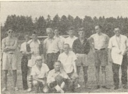
— og det tabende

21. nov.: Skolefesten for de 3 yngste klasser. Gymnastiksalen på Østre skole var fyldt til trængsel til skolefesten for de små elever, idet der deltog ca. 600 forældre og børn samt lærerpersonalet. Efter at skoleinsp. Vester havde budt velkommen, opførte 3. klasserne forskellige molbohistorier, der var dramatiserede, og sang nogle sange fra sangspillet »Molboerne« og gjorde stor lykke. Der blev bagefter danset i samlingsalen i kælderens. Pølsebar'en