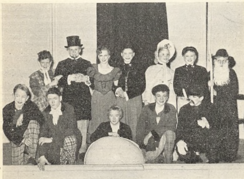
Aktørerne i „Genboerne“

23. nov.: Skolefesten for de små elever. Klasselærerne i de fire 3. klasser havde hver indstuderet små, festlige optrin. Skolen bringer alle medvirkende sin bedste tak. Derefter ryddedes salen, og nu legede og dansede børnene et par timer. Festen varede fra kl. 16 til kl. 19 og havde god tilslutning.