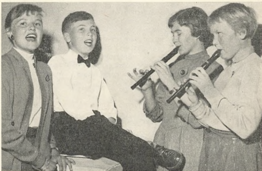
Samarbejde mellem Århus—Grenaa og Holstebro.

27. og 28. april (bededagsferien) var der udflugt til Mollevangsskolen i Århus, hvis elever havde besøgt Grenaa Vestre skole i dec. 55. Turen, som var meget vellykket — ikke mindst på grund af den store gæstfrihed, der udvist fra Mollevangsskolens side — havde ca. 80 deltagere fra Grenaa. Desuden var der børn fra Holstebro og Ålborg.