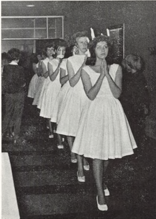
Fra det smukke Lucia-optog. Vi kom i julestemning med det samme.

13/12 Julen nærmer sig. Det mærkes tydeligt på skolen. I dag til morgen var skolen smukt pyntet med gran og levende lys. Straks efter indringningen om morgenen