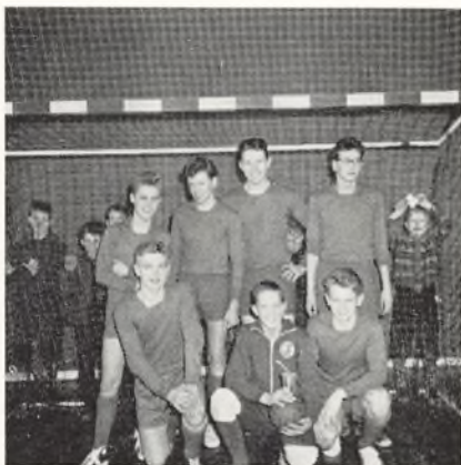
Holder der erobrede pokalen ved »Djurslands« håndboldstævne den 13. februar: