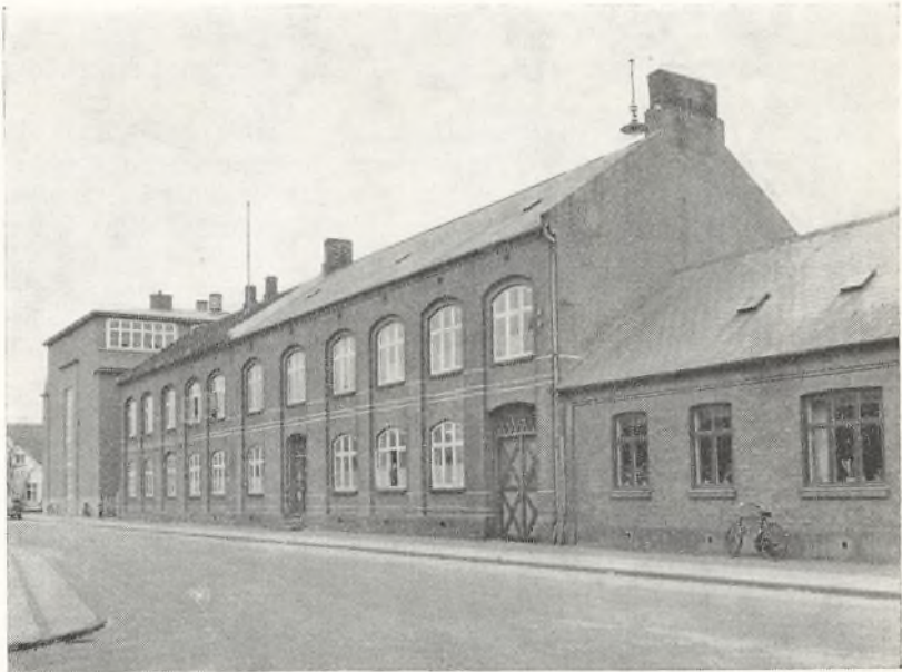
Den gamle fløj, som måtte vige for udviklingen.

Skolebyggeriets næstsidste del er tilendebragt. Fem nye lokaler blev først taget i brug, dernæst et dejligt lærerværelse, som alle berømmer. Sidst