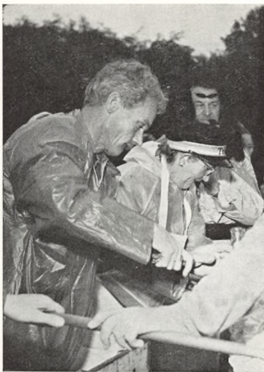
Håndbold dysten mellem lærere og elever var lidt ud over det almindelige. Energien og koncentrationen lyser ud af ansigterne.

På grund af det omfattende byggeri på skolen måtte vi i år undlade den årlige sammenkomst med Hasle skole. I stedet arrangeredes en lokal venskabsmatch mod Østre skole. Desværre var vejrguderne ikke velvilligt indstillet over for arrangørerne, men alligevel fik stævnet et yderst vellykket forløb. Endnu engang måtte vi ned med nakken til de dygtige spillere fra Østre skole. Drengenes fodboldkamp endte med sejr til gæsterne 2-1, ligesom de i håndbold sejrede 9-8. Østres piger vandt 2-0 i en