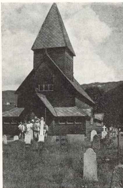
Jo, der er dejligt i Norges land.

På vandrehjemmet spises den medbragte mad, hvorefter byen beses. I seng! Op kl. 6,30! Og så bagefter af sted med M/S Skagen med Kristianssand som mål. Havet er