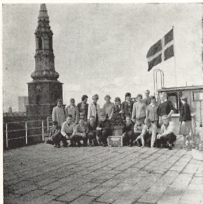
Over byens tage

Turen begyndte mandag den 5. september fra Grenaa banegård og gik over Aarhus-Kalundborg til København. Da vi kom til Københavns Hovedbanegård, tog vi S-toget