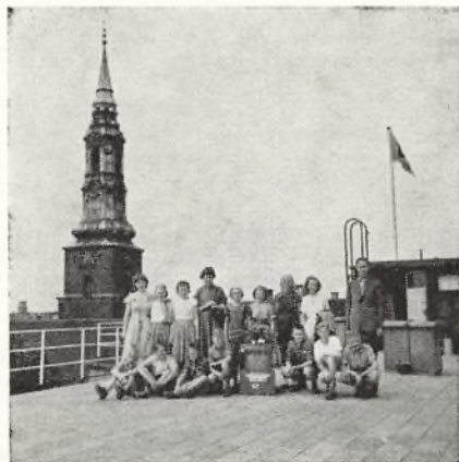
På toppen af Daells Varehus

Vi startede her fra Grenaa kl. 9.45 og ankom ved 18-tiden til Strandvejen 93 i København. Om aftenen var vi på Langelinie.