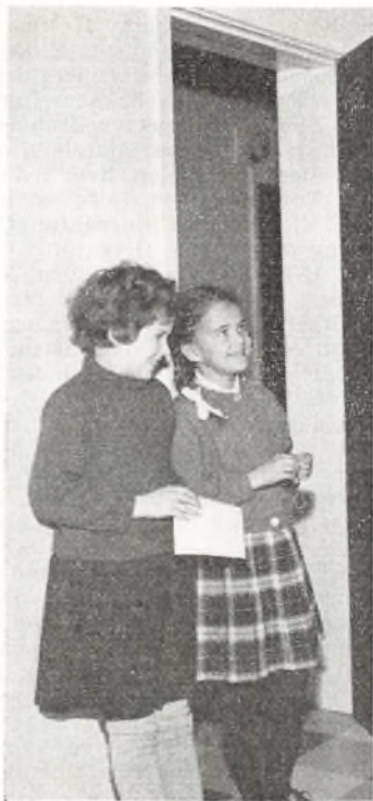
»Åh — det lettede vel nok!«

fået arrangeret en stor udstilling i menighećshjemmet. Skolens klasser var inviteret og besøgte udstillingen klassevis. Foruden gennemgang af udstillingens bøger så man film og deltog i konkurrencer med bøger som præmier.