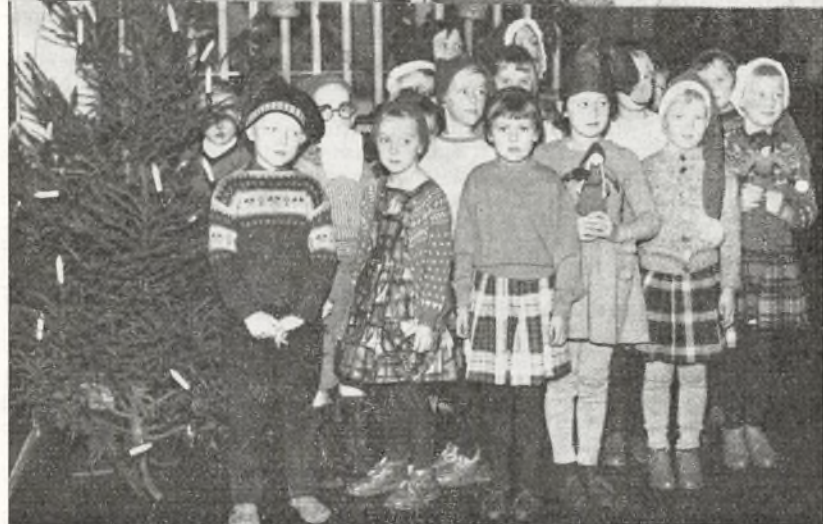
— Julen er nu alligevel en dejlig tid!