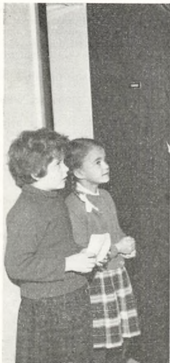
»Må vi godt få fri?«