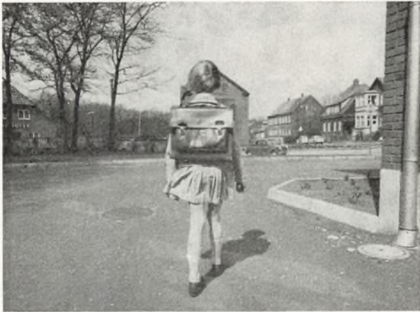
men således —

Og hvorfor? Det er indlysende, at »håndtasken« let giver en dårlig holdning. Den bæres i samme hånd, og lidt efter lidt vil der derved opstå en skævhed i rygsøjlen. I gamle dage bar man »bøgernes byrder« sikkert og godt i et tornyster på ryggen. Det ser ud til, at mange forældre igen ser det som deres opgave at forhindre, at børnene misdannes — måske endda af forfængelighedsgrunde. Sæt altså skulderremme på tasken.