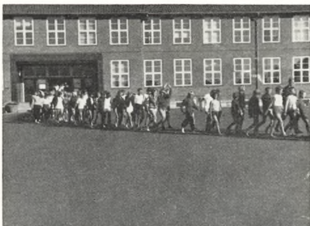
De udvalgte sportsrepræsentanter fra hvert klassetrin marcherer ned gennem skolegården

Skolemesterskaber i atletik blev afholdt sammen med klassemesterskaberne, og for drengenes vedkommende blev resultatet: