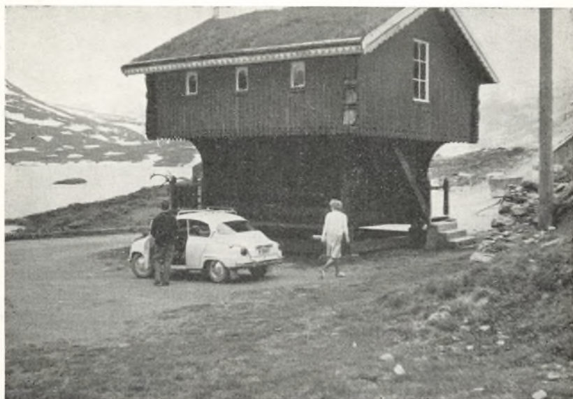
Fra Norgesturen juni 1964