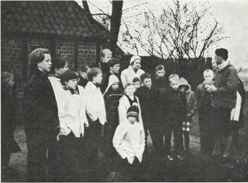
Ved Øm klosterruin