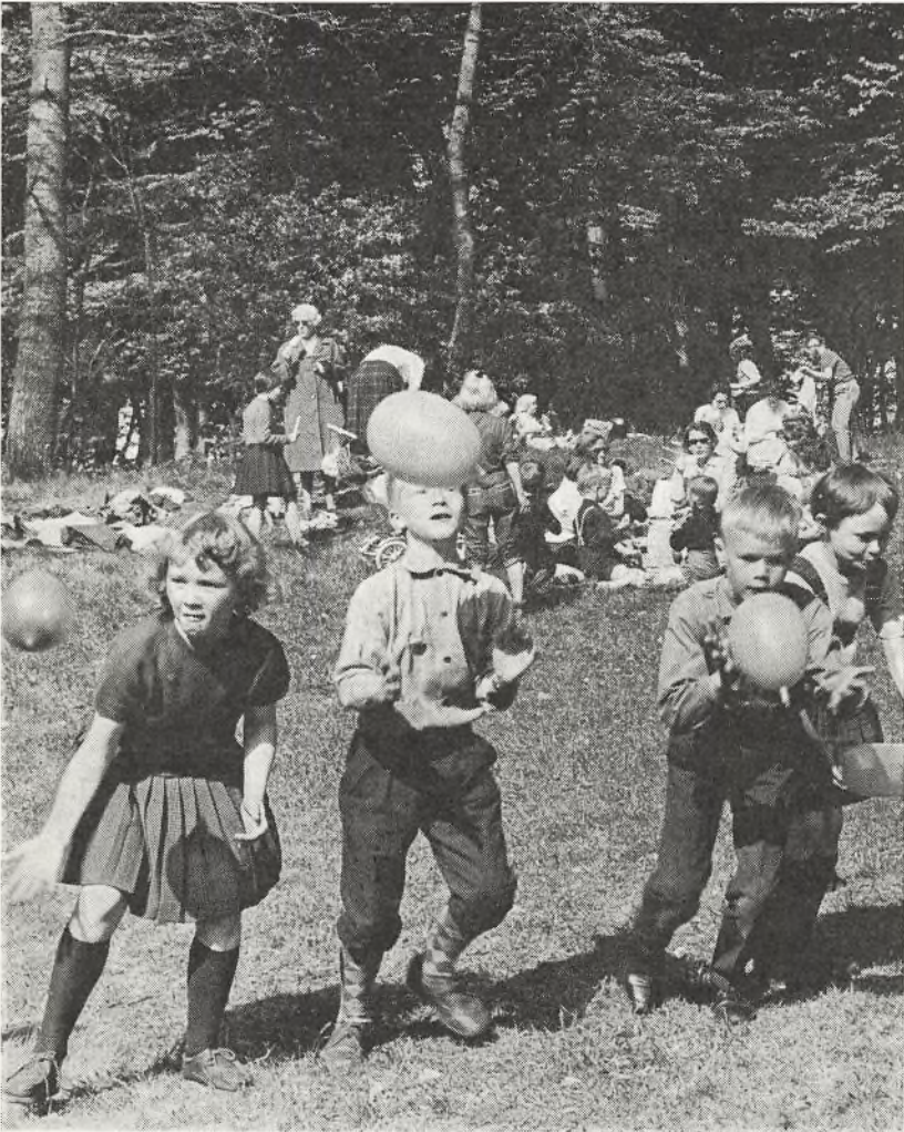
De små klassers skovtur til Gjerrild