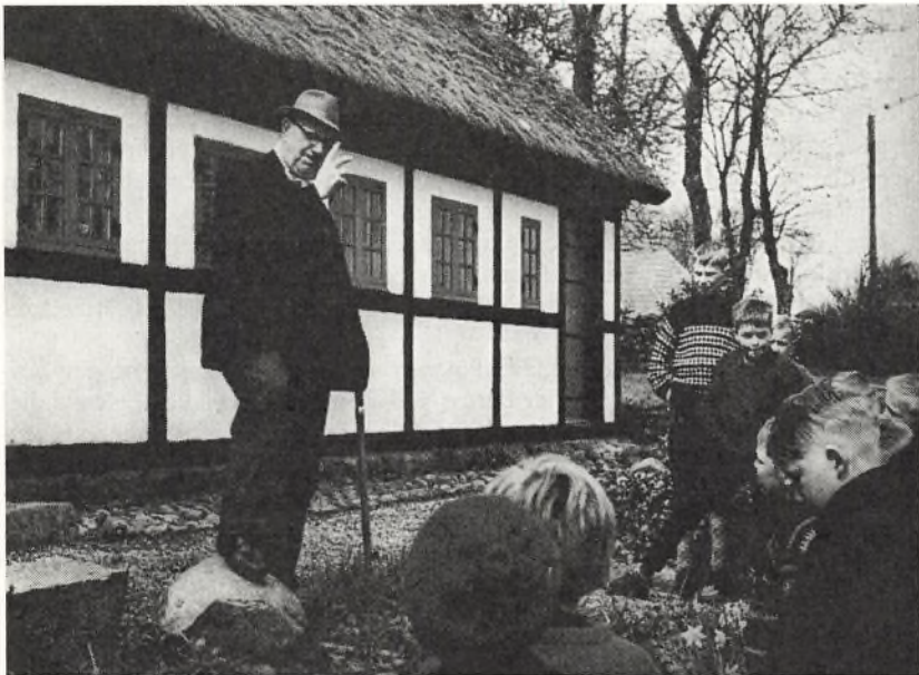
Den gamle lærer fortæller om æ bindstouw